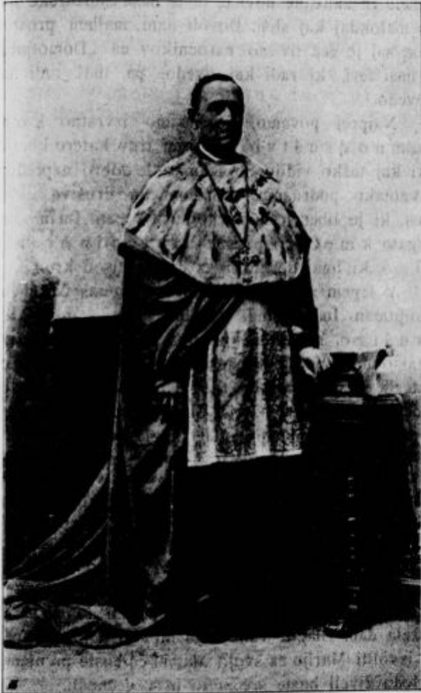
† Kardinal dr. Jakob Missia.

pa saj jih tudi Kitchener pozna, gotovo še bolje, pa jim ničesar ne more. Kitchener bo sedaj lahko sam dejansko stopil v boj in imel v rokah vrhovno vodstvo, kar sedaj ni mogel, ker je vedno bival v Pretoriji. — Reklo se je, da Italija prevzame posredovanje med Angleži in Buri; toda zunanji minister je na neko interpelacijo odgovoril, da na to ni misliti, ker Anglija ne sprejme nobenega posredovanja. Pač on želi, da bi se čimprej končala pogubna vojska. Torej iz strahu pred angleško zamero tudi Italija le želi konec vojske kot druge evropske države. — Burske čete so se pomnožile; menda je 35 000 bojnikov. Zaradi zadnjih sramotnih porazov vlada med angleškim prebivalstvom velika nevolja. Na mnogih krajih države prirejajo shode, kjer predlagajo in sprejemajo resolucije za konec vojske. In res se zadnje dni veliko piše o premirju, ki bi ga sklenili Angleži in Buri, in o pogojih, ki jih oboji stavijo; toda poročila se malo vjemajo, kar kaže, da bo takrat konec in mir, kadar Angleži popolnoma opešajo.