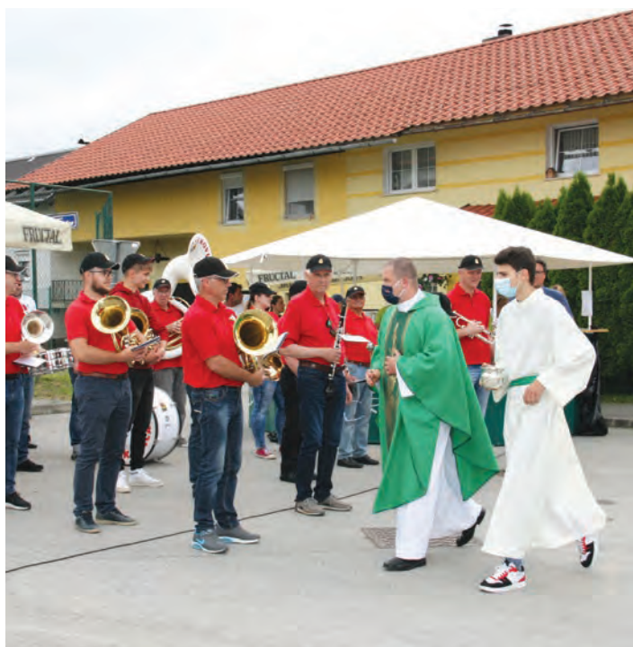
Tradicionalni nastop Godbe Lukovica.