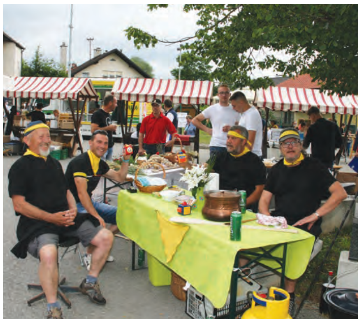
Cicibančki, zmagovalna ekipa v kuhanju golaža.