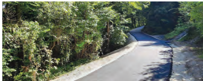
BESEDILO IN FOTO: OBČINSKA UPRAVA

Usklajen je načrt notranje opreme. V pripravi je postopek javnega naročila za izbiro dobavitelja notranje opreme (opreme učilnic, garderob ...). Izvedena je bila obnova cestnega propusta v Trnjavi. V postopku evidenčnega naročila je bil izbran izvajalec del GP Hribar d.o.o., pogodbeno vrednost del je znašala 10.799,44 EUR z DDV.