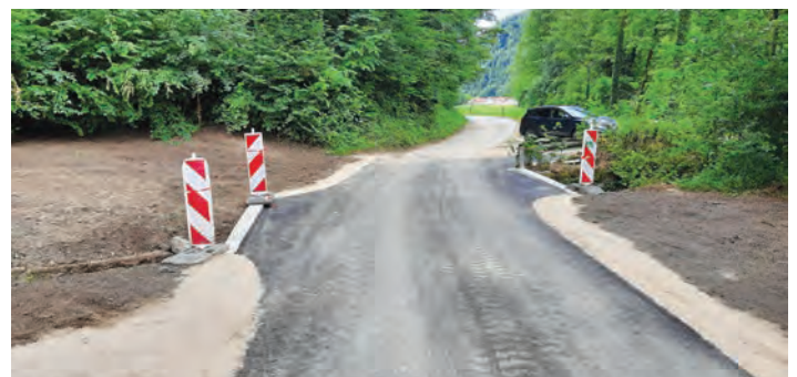
Sanacija cestnega propusta v Trnjavi.

Prav tako je bila izvedena sanacija usada cestišča na lokalni cesti Blagovica–Vranke. V postopku evidenčnega naročila je bil izbran izvajalec del GP Hribar d.o.o., pogodbena vrednost del je znašala 11.391,12 EUR z DDV.