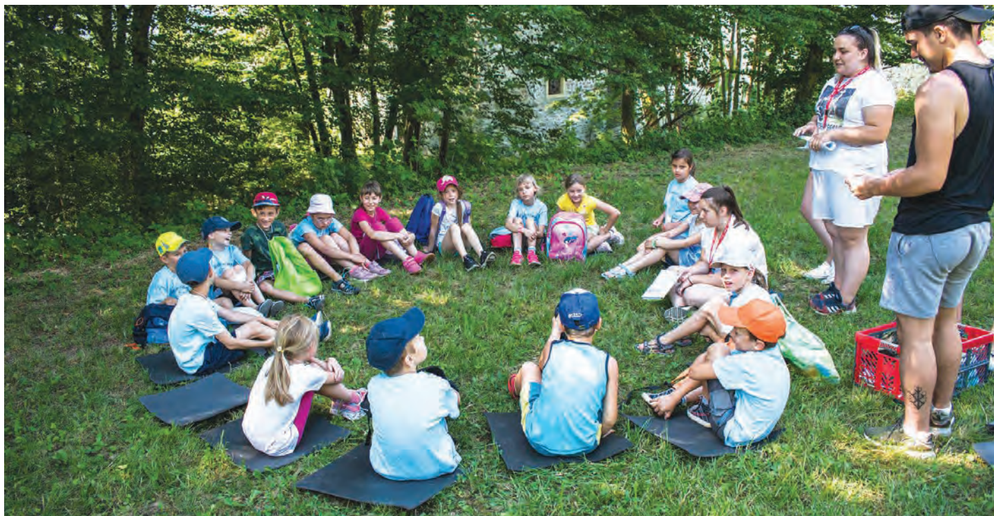
Delo v skupinah.