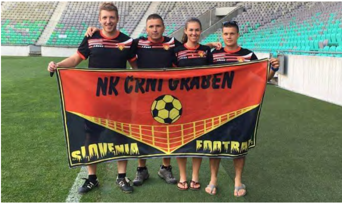
NK Črni graben na stadionu Stožice.