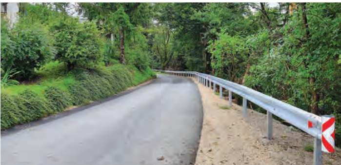
Sanacija usada cestišča v Preserjah pri Zlatem Polju.

Izvedena je bila sanacija usada cestišča in ureditev meteornege odvodnjavanja v Preserjah pri Zlatem Polju. V postopku evidenčnega naročila je bil izbran izvajalec del GP Hribar d.o.o., pogodbena vrednost del je znašala 23.071,42 EUR z DDV. Dobavljena in vgrajena je bila varovalna ograja s strani izvajalca del Kveder d.o.o., pogodbena vrednost del je bila 2.975,58 EUR z DDV.