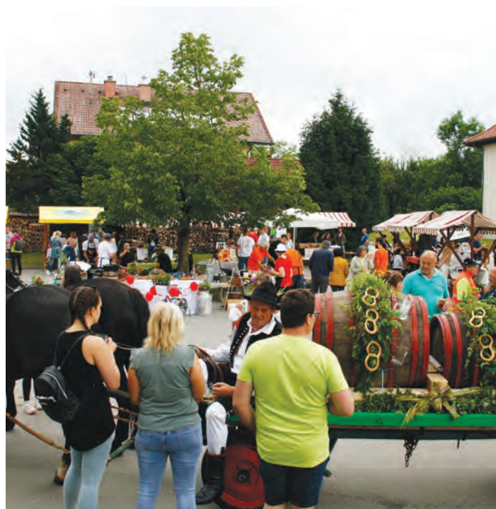
Glavno prizorišče 10. Vidovega sejma.