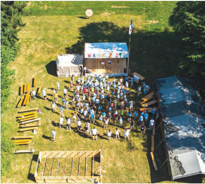
Glavno prizorišče oratorija.

nismo vedeli, v kakšni obliki bomo lahko izvedli oratorij oziroma ali ga sploh bomo.