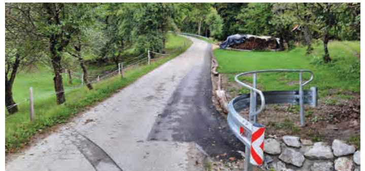
Ureditev meteornege odvodnjavanja v Preserjah pri Zlatem Polju.