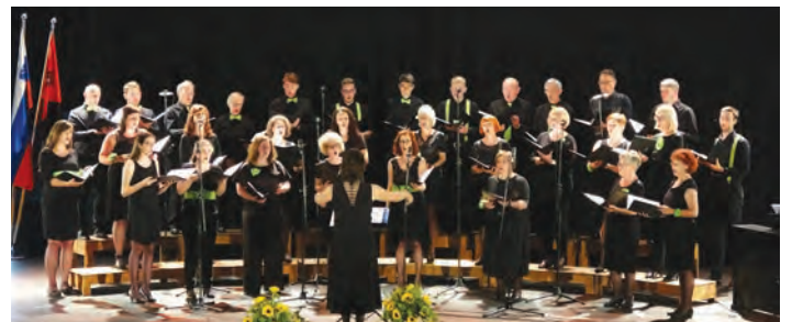
MePZ Šentviški zvon.

BESEDILO: MOJICA STOSCHITZKY