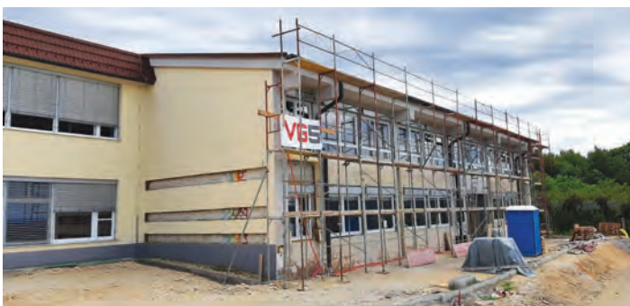
Preureditev stare telovadnice v šolske učilnice.