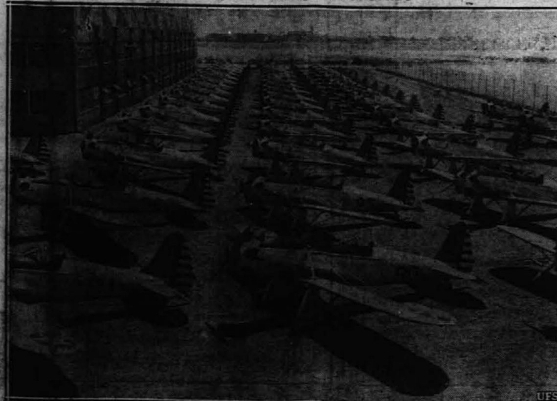
Mnošica vojaških aeroplanov, ki so bili izdelani v neki tovarni v San Diego, Cal., in čakajo na prostoročno tovarno, da bodo oddani v uporabo. Razdeljeni bodo po letalskih šolah za veščanje pilotov.