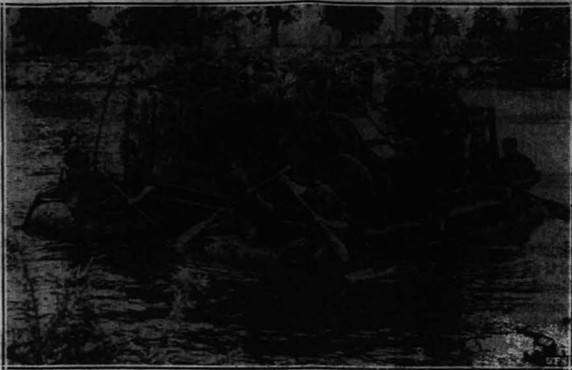
Pri prehodu prek rek se nazirajo vojaštvo postužeje splavov, kakoršnega kaže gornja slika. Bržkone so ti splavi zgrajeni na napihnjenih gumijastih čolnih, ki jih nazivajo velikih množinah uporabljajo.

SVETA PASTIRICA IZ SAINT AFRIQUE, (l. 1849) je zapustila dragocen pisan