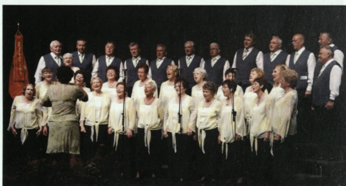
Pevski zbor DU Šoštanj se je zelo dobro predstavil na reviji Pokrajinske zveze DU šaleške doline.