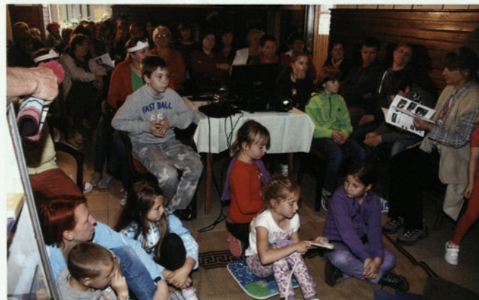
Film Toplina domače volne bo premierno prikazan že koncem junija.