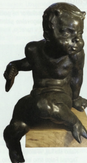
Favns v Vili Mayer.

Pan, ljubitelj glasbe, se pogosto zaljubi. Najraje prebiva v Arkadiji, kjer tava po gozdovih, lovi divjad, pleše z nimfami in jih zabava s svojo piščaljo. Arkadija je mitološka pokrajina idealiziranega in miroljubnega pastirskega življenja. Morda je bil motiv Favnsa oz. Pana ravno zaradi vseh teh pomenov preiščeno izbran za fontano novozgrajene Vile Široko.