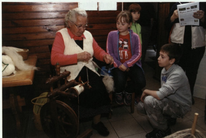
Soustvarjalci filma Toplina domače volne so si na Paškem Kozjaku z zanimanjem ogledali obdelano gradivo za filmski film.