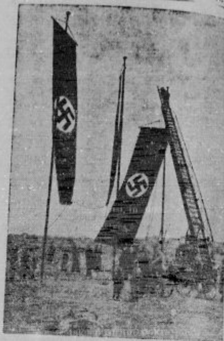
V Nemčiji bodo prvi dan maja, ki je bil nekda socialistični praznik, slavili kot dan narodnega žala. V Tempelhoferu pri Berlinu se bo zbrala ogromna masa ljudi, ki jo bodo hitlerjevci »reklamno in seveda tudi s pritiskom spravili tja. Na tempelhoferškem polju že sedaj delajo poizkušee, kako bodo vibrale Hitlerjeve zastave. S posebnimi aparati raziskujejo smeri vetrov, da potem obrnejo z glavnemu mestu Kitajske. Prebivalstvo je že zaslavo tako, da bo čim bolj vibrala...