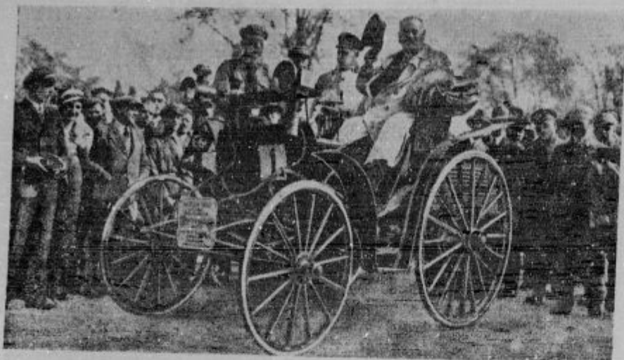
Prizor s spreveda, ki so ga vprizorili v Mannheimu na čast Karlu Benzu. Na avtomobilu, ki ga je sam sestavil Karel Benz, se vozijo njegovi sinovi.