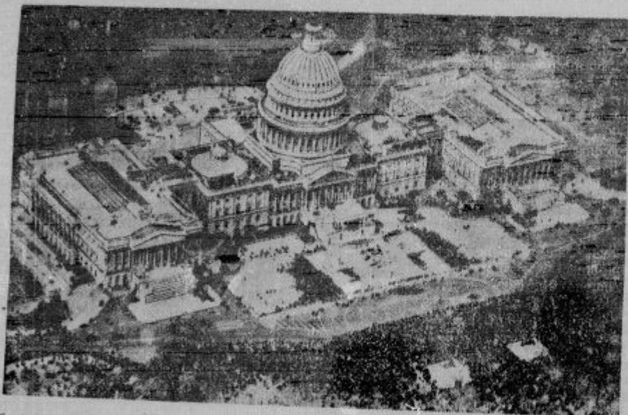
Kapitol, sedež predsednika Združenih držav, kamor romajo te dni predstavniki skoro vseh evropskih držav, da bi od Amerike izposlovali brisanje vojnih dolgov.