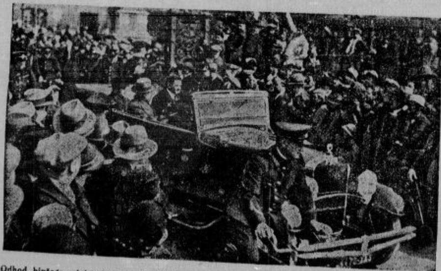
Odhod bivšega ministrskega predsednika E. Herriota v Le Havre v Le Havre, kjer se je vkrcal na znani francoski parnik »Iste de France«, ki je odplul v Newyork. Herriot bo branil francoske koristi na posvetovanjih v Washingtonu glede vojnih dolgov