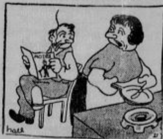
Žeparjeva žena: »Kaj pa te zanima v modnem časopisu?« Žepar: »Zanima me, kakšne žepne prišese nova moda.«