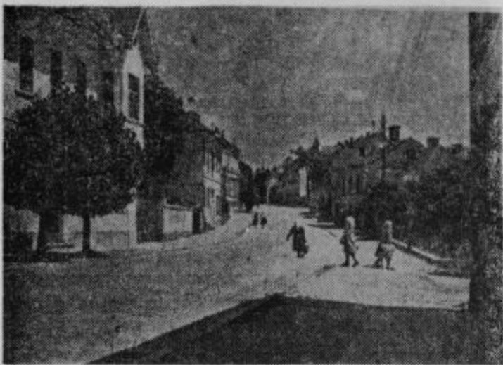
Poslovni del Ormoža. Levo spredaj: Zadrzna poslovna zveza.