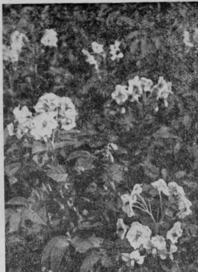
Po Dravskem polju že cvete krompir

centralna menza ter omogoči, da bodo dobili ljudje po ugodnih cenah kvalitetno, okusno hrano, prav tako pa je nujno rešiti vprašanje toplega obroka-malice, kar bo ugodno vplivalo na delovno stornost, zdravje in razpoloženje delavcev. Po vrnitvi s IV. kongresa bom vse svoje sile posvetil skupaj z mojimi delovnimi tovariši, da s škode kongresa izvedemo v življenje, da z njimi seznanimo vse delavce v našem, prav tako pa v ostalih kolektivih.«