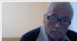
17. redna seja (ZOOM)