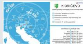
Občina Kidričevo - Municipality ...