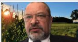
18. redna seja (ZOOM)

Dogajanju v naši občini lahko sledite tudi na povezavi https://vimeo.com/kidricevo