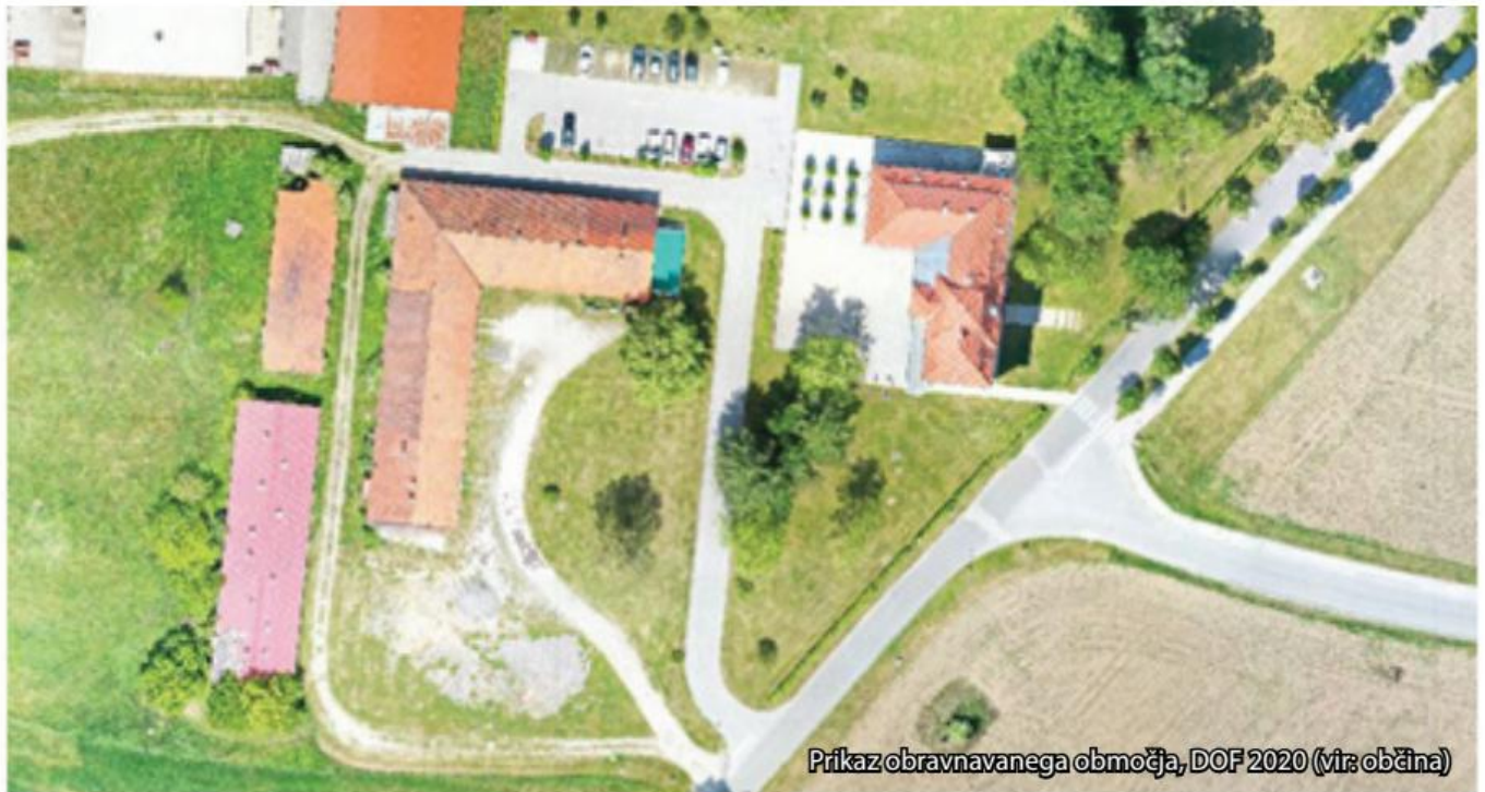
Prikaz obravnavanega območja, DOF 2020