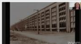
Urbanistična arhitekturna zasnova ...