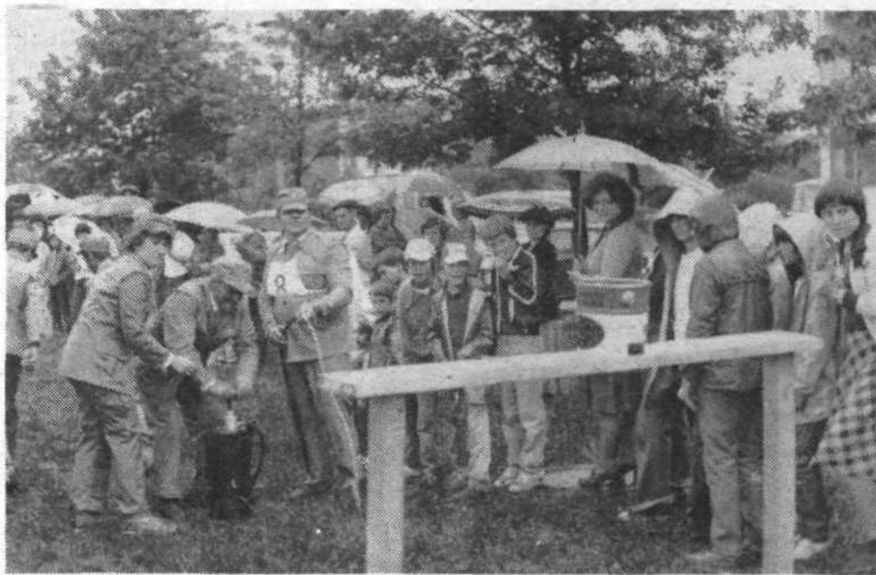
Štab za civilno zaščito krajevne skupnosti Boris Zihari je organiziral tekmovanje splošnih enot civilne zaščite v vaji z vedrovko in štafetni vaji s prenosom torbice prve medicinske pomoči. V slabem vremenu je sodelovalo 18 ekip, od tega 8 iz organizacij združenega dela. Na sliki je ekipa Slovenija avta pri vaji z vedrovko. Ob progi se je zbralo tudi precej občanov, zlasti mladine, ki so z zanimanjem spremljali tekmovanje in bodrili udeležence.