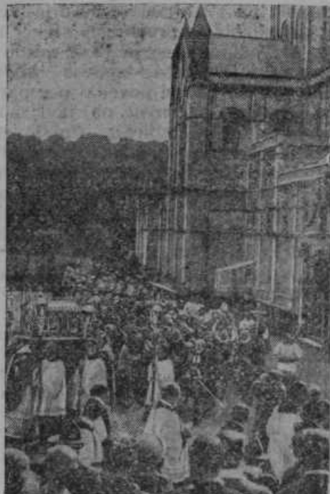
Pet benediktincev iz Virtemberške je pozidalo tekem 25 let brez tuje pomoči v Buckfast Abbey na Angleškem od Henrika VIII. porušeno opatijsko cerkev.

Da bi njihova beseda bila glasnejša in močnejša, so agrarne države uvidele potrebo složne besede. Tej svrhi služijo konference poljedelskih držav srednje in vzhodne Evrope. Takšna konferenca se je vršila zadnji teden