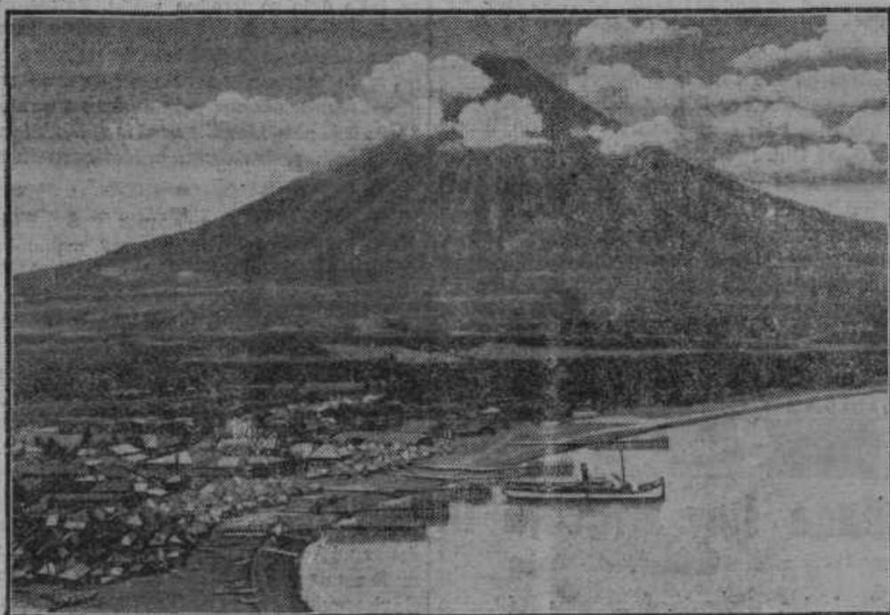
Silen potres na Filipinskih otokih v Kitajskem morju je ničil na stotine hiš in je več tisoč družin brez strehe.