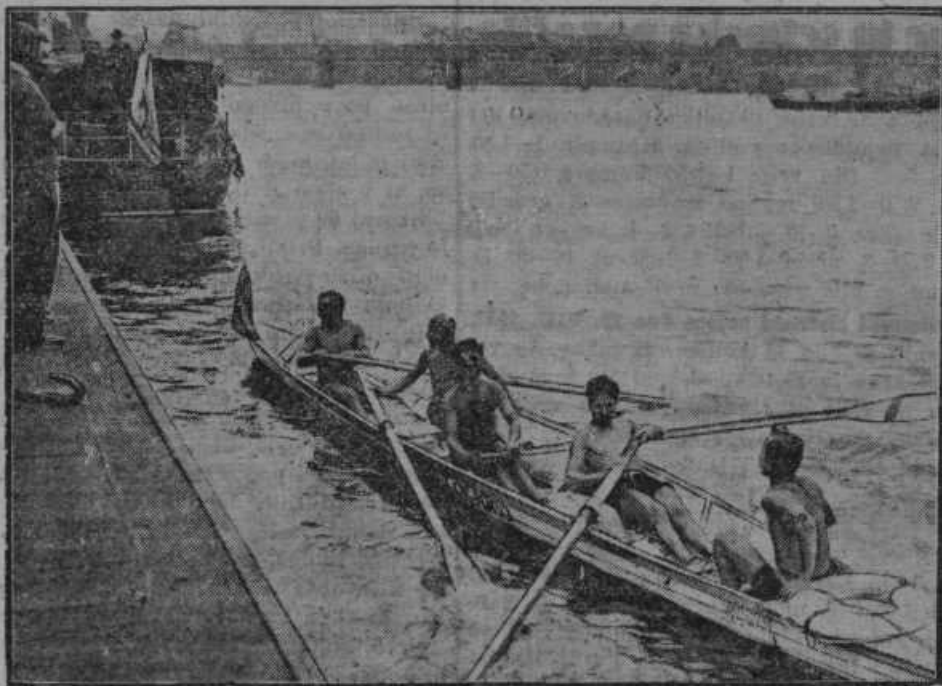
Pet mož hoče preveslati v čolnu po morju iz Italije na Angleško.

Kmetijska razstava na letošnjem jesenskem velesejmu v Ljubljani od 3. do 12. septembra obsega: a) Strokovno-poučni kmetijski oddelek. b) Sirarsko in mlekarstvo, na kateri sodelujejo skoraj vse mlekarke in sirarske zadruga. c) Razstavo jajc. d) Čebelarstvo razstavo in sejem za med. e) Zelenjadno razstavo. f) Vinsko razstavo in sejem. Ta del kmetijske razstave organizira kmetijski odbor velesejma. Kmetijski razstavi so priključene še: g) Razstava goveje živine montafonske pasme, ki jo priredi živinorejska zadruga Jugomontafon. Razstava se je vršila 3. in 4. sept. h) Razstavo perutnine in kuncev priredi Društvo rejcev malih živali »Zivalica«. Tej razstavi sta priključeni še razstavi ribic in ptic. Razstava traja od 3. do 12. septembra. i) Kmetijski odbor velesejma priredi dne 10. in 11. septembra razstavo plemenskih konj. j) Ves