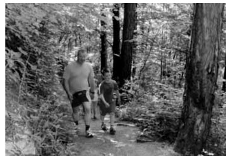
Družine so pogoste obiskovalke trima

Obiskovalci so prišli iz različnih krajev: Mengša, Loke, Domžal, Radomelj, Jarš, Doba, Ihana, Prevoj, Količevega, Vira, Rodice, Depale vasi, Trzina, Šmarce, Most, Komende, Šenčurja, Skaručne, Homca, Nožic, Duplice, Stahovice, Kamnika, Kranja, Črnuč in Ljubljane. Nekateri obiščejo trim vsak dan, drugi dvakrat tedensko, ostali nekajkrat mesečno, ponavadi konec tedna. Prihajajo posamezniki, zakonski pari, zelo veliko je mladih družin. Mlajši otroci si zelo radi ogledajo tudi živali pri Mengeški koči. V gostišču se je možno odžežati in okrepčati, v tem času pa tudi posladkati s sladoledom. Na Gobavici poteka tudi gozdna učna