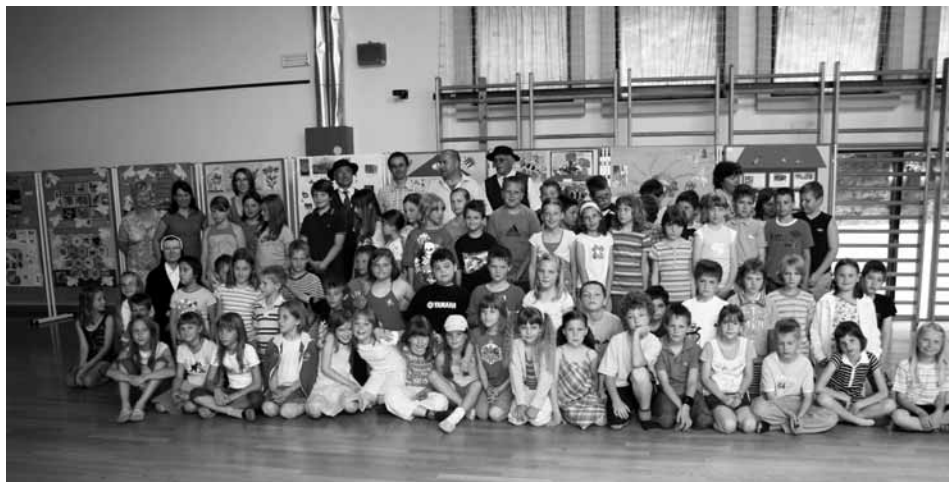
Skupinska fotografija udeležencev in gostov prireditve