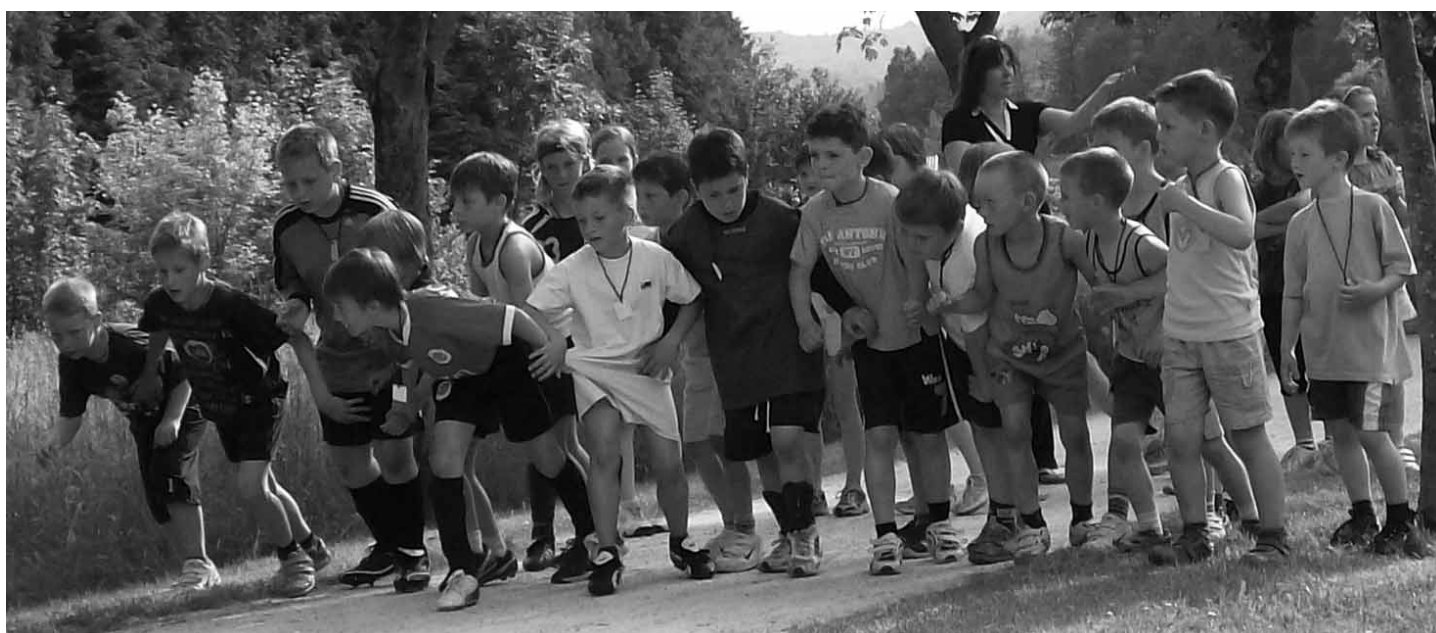
Udeleženci Trdinovega teka

Predsednica Turističnega društva Mengeš,