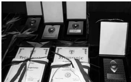
Priznanja Občine Mengeš