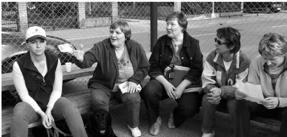
Veselo razpoloženje na košarkarskem igrišču v Mengšu