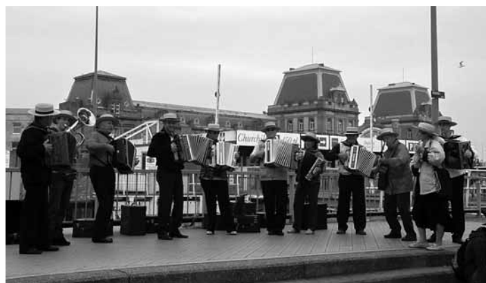
Društvo harmonikarjev Mengeš se je predstavilo na ulici.