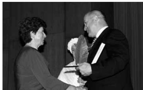
Župan izroča zlato priznanje