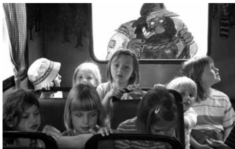
Vozili smo se z Bedanc busom