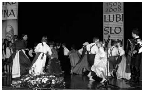
Otroška folklorna skupina OŠ Mengeš