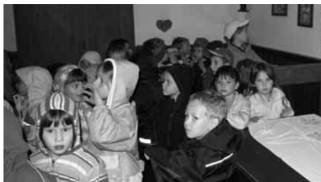
V Pehtinem bivališču