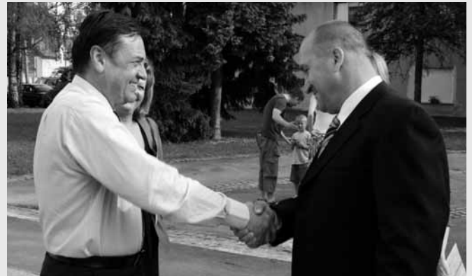
Topel sprejem za ljubljanskega župana