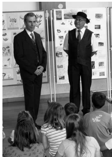
Obisk članov Čebelarskega društva

Na datum občinskega praznika, 29. maja, sta učenci 8. razreda z mentorico v jutranjem programu TV Slovenije predstavili projekt Osnovne pole Mengeš – Pot Janeza Trdine , 6. junija pa smo v sodelovanju s Turističnim društvom Mengeš širši javnosti projekt tudi predstavili. Udeležence pohoda