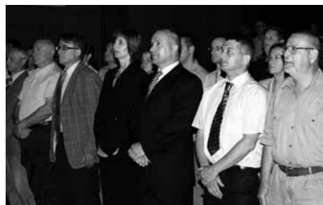
... in občinstvo je vstalo.