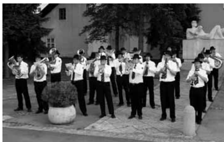
Mengeška godba pred KD Mengeš