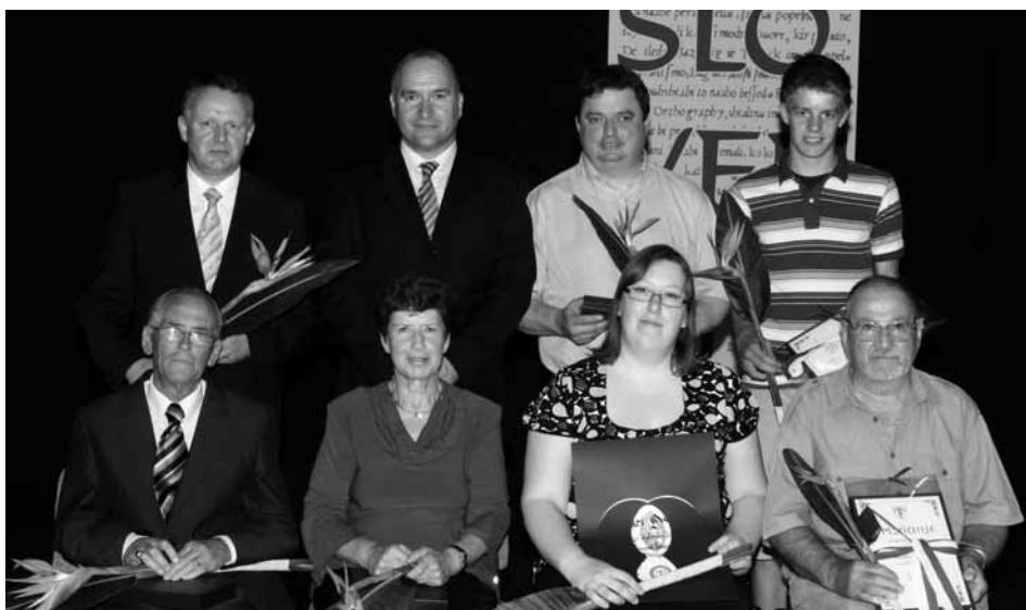
Dobitniki priznanj Občine Mengeš v letu 2008