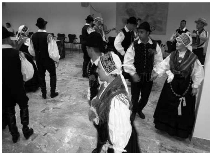
Folklorna skupina Svoboda je nastopila v dvorani.