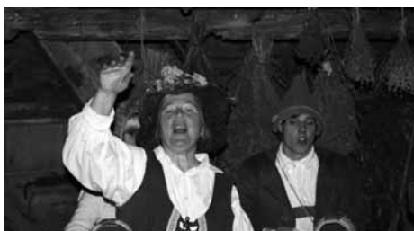
Pehta je bila prav prijazna