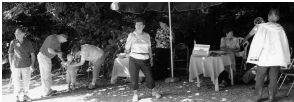
Informacijska pisarna na štartu