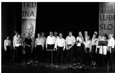
MePZ Svoboda je zapel slovensko himno ...