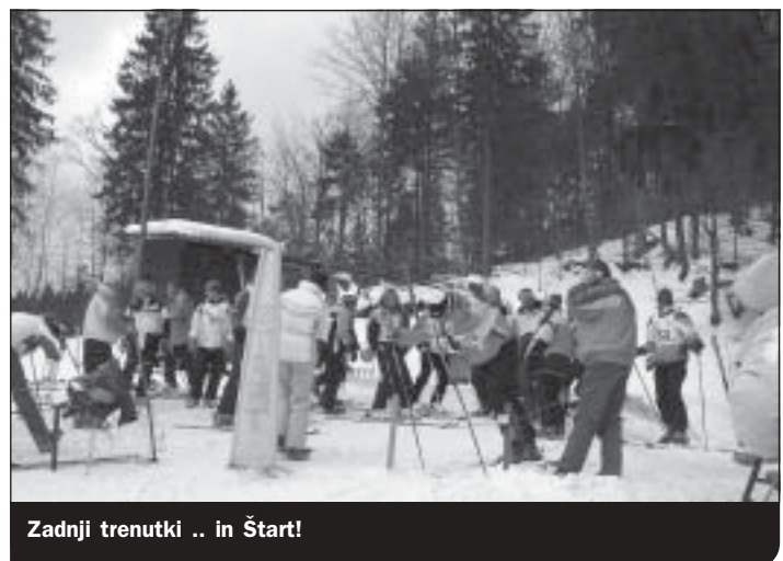
Zadnji trenutki .. in Start!