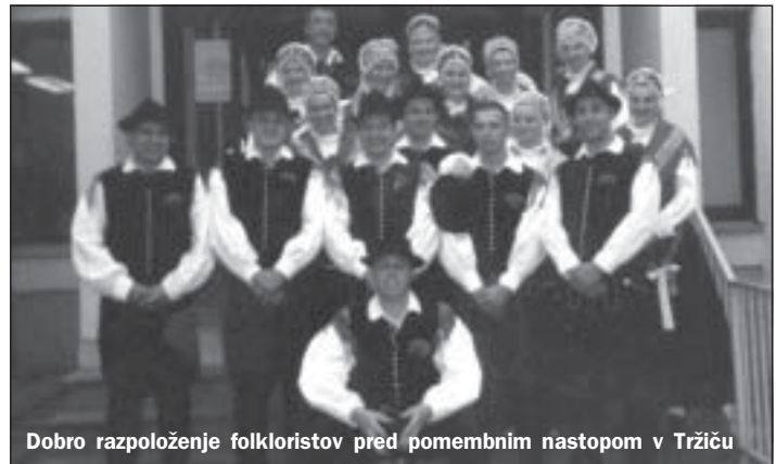
Dobro razpoloženje folkloristov pred pomembnim nastopom v Trzinu

Žal pa se folkloristi že nekaj časa spopadamo s prostorski težavami. Res je, da trenutno vadimo v lepih prostorih, to je v večnamenski plesni dvorani nad knjižnico. Vendar moramo za te vaje plačevati najemnino, kar je v 29 letni zgodovini folklorne skupine prvič. Če se ne motim, smo edina aktivna skupina oz. društvo v Mengšu, ki mora za redne vaje plačevati najemnino. Resda nam najemnino ne zaračunavajo po tržni ceni, vendar pa pri tako majhni dotaciji občine, tudi ta strošek predstavlja kar veliko finančno breme.