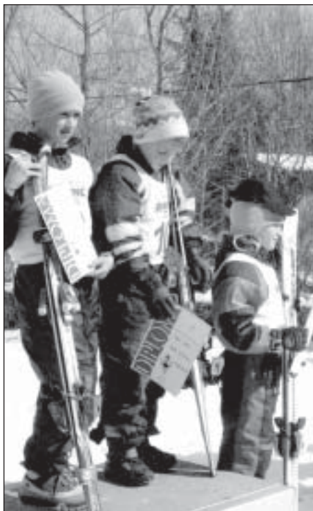
Bodoči skakalci, najboljši na veliki skakalnici