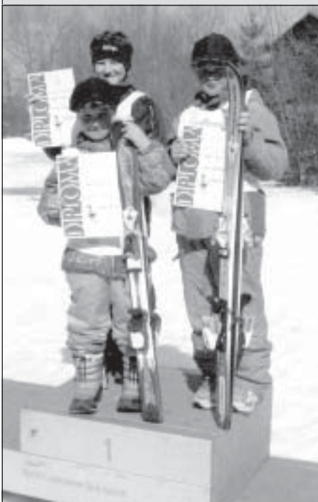
Bodoči skakalci, najboljši na mali skakalnici