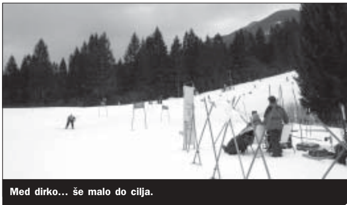
Med dirko... še malo do cilja.

Sedmo odprto prvenstvo Občine Mengeš v veleslalomu so prizadevni člani Smučarskega društva Mengeš tudi letos pripravili na Koblj in sicer v nedeljo 16. februarja. Množica tekmovalcev in tekmovalk, kar 127, se je zvrstilo na dobro pripravljene veleslalomski progi v malo mrzlem a lepem vremenu. Najboljši so si priborili lepe kolajne in diplome, vsi udeleženci pa so prejeli simbolična darila. Tekmovanje je vsekakor uspelo, udeleženci pa so obljubili, da pridejo tudi naslednje leto. Vsem sponzorjem, ki so podprli letošnjo tekmo, se člani smučarskega društva lepo zahvaljujemo in upamo, da bo tako tudi v prihodnje. Veseli pa smo bili tudi fotografskega prispevka gospoda Trplana, katerega del objavljamo tudi ob rezultatih.