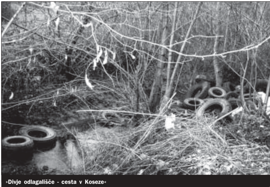
»Divje odlagališče - cesta v Koseze«

Oddaja nevarnih gospodinjskih odpadkov bo v sredo 9. aprila od 17. – 19. ure na