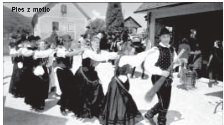
Ples z metlo

kulturno središče še naprej potrebuje kvalitetno folklorno skupino, ki je v letih od ustanovitve do danes, svojimi nastopi uspešno predstavljala slovenski ljudski ples doma in na tujem. Z dodelitvijo plesnih prostorov, bi bili tako rešeni velikih težav in dilem in dalo bi spodbudo ter novega zagona mlajšim in vsem dolgoletnim članom, ki že vrsto let upajo in čakajo, da bo Folklorna skupina Mengeš, končno prišla do svojih prostorov. Dva sestanka pri gospodu županu do sedaj še nista obrodila sadov, vendar upamo, da bomo enkrat le našli rešitev.