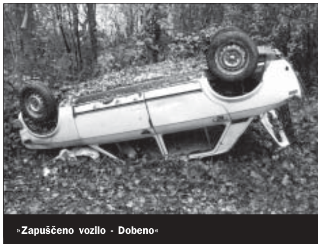
»Zapuščeno vozilo - Dobeno«

parkirišču za Kulturnim domom Mengeš. Odpadle kemikalije, zdravila, baterije, akumulatorji, embalažo škropiv, olja, barve, laki ipd. boste lahko oddali na kraju zbiranja. S skupnimi močmi poskrbimo, da bo občina Mengeš čista in urejena – ne le v spomladanskem času!