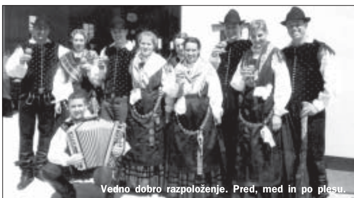
Vedno dobro razpoloženje. Pred, med in po plesu.