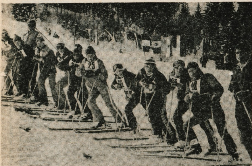
Na starovrških smučiščih sta naši pionirski reprezentanci dosegli zavidljiv uspeh.