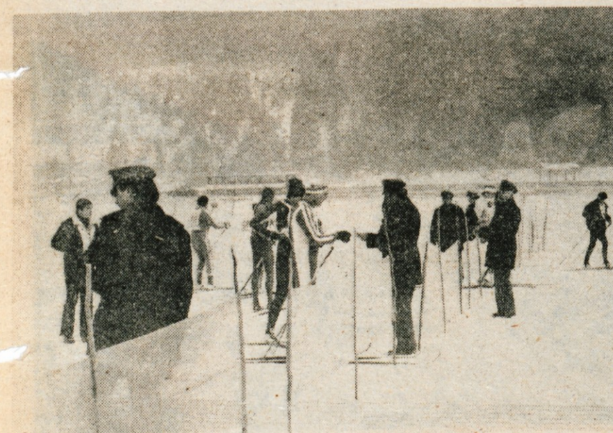
Vsi tekmovalci na Teku treh dežel so morali skozi obvezno obmejno kontrolo pred startom in tako so obmejni organi delali v dokaj nenavadnih okoliščinah. Njihovo delo in start množične prireditve pa si je v Kranjski gori ogledal tudi Stane Dolanc.