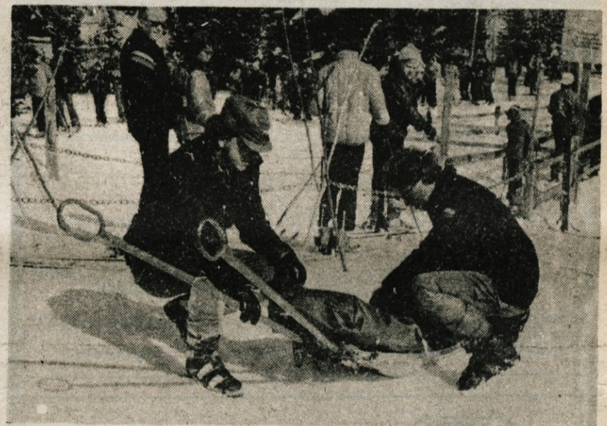
Nezgodna na smučišču. Miličnika — reševalca se pripravljata za pomoč.

sledno izvajala zakona o varnosti na javnih smučiščih. Premalo je skrbela za red pred žičnimi napravami in opozarjala na nepravilnosti. Na Krvavcu letos še ni bilo primera kraje smučar in druge smučarske opreme; tudi v soboto