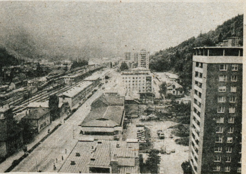
V jeseniški občini predvidevajo izgradnjo več novih stanovanjskih blokov, kajti stanovanjske potrebe so velike.

Na to vprašanje je dobil naslednji odgovor: ta odlok o urejanju, vzdrževanju in varstvu zelenih površin nima namena podajati konkretnih rešitev, ampak način reševanja vprašanja urejanja zelenih površin. Ta predlog o ureditvi tega prostora je zajet v veljavnem zazidalnem načrtu kulturnega centra Jesenice, ki ima dolgoročen značaj. Začasna rešitev oziroma predlog bi se lahko posredoval strokovni službi — BUSP — komunalni skupnosti.