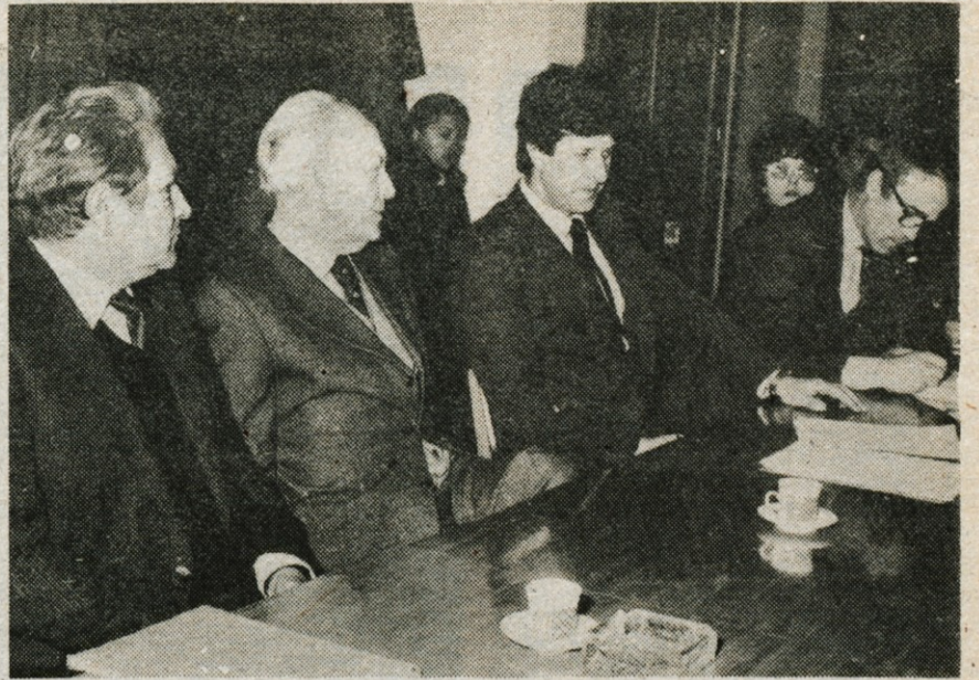
Jesenice — Član predsedstva SFRJ Sergej Kraigher je obiskal jeseniško občino in se najprej pogovarjal s predstavniki skupščine občine in družbenopolitičnimi organizacijami, nato pa se je udeležil pogovora v jeseniški železarni in širšega političnega aktiva jeseniške občine.