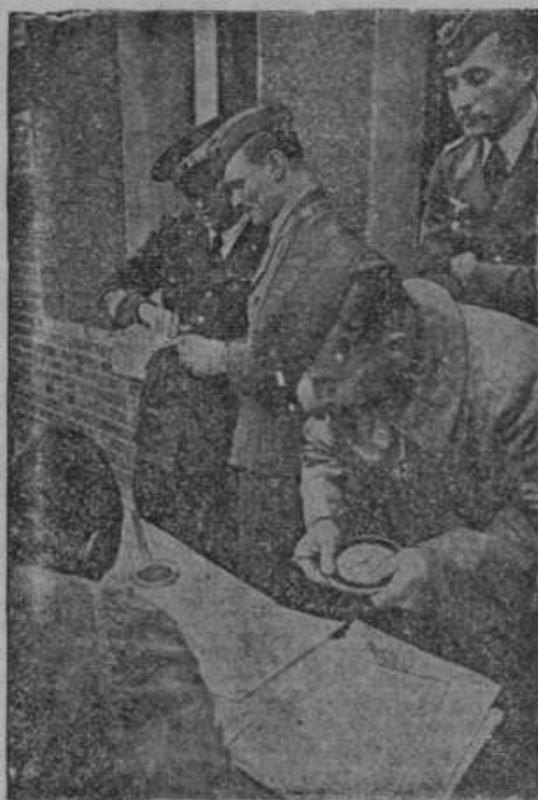
Nemški in Italijanski letalski častniki v pogovoru o skupnem poletu nad Anglijo