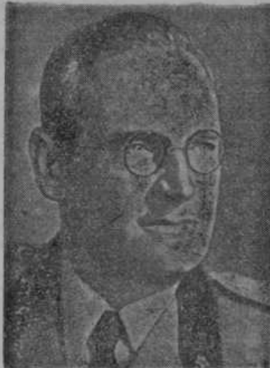
Italijanski general Soddu, vrhovni poveljnik Italijanske armade na grški fronti