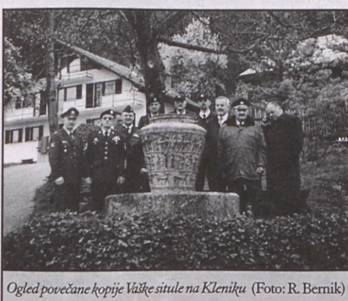
Ogled povečane kopije Vaške situle na Kleniku

Častniki Nacionalne garde Kolorada so skozi predavanje predstavili delovanje Nacionalne garde, organizacijo obojestranskih sil Združenih držav Amerike, plače in ugodnosti pri zdravniški in zobozdravniški oskrbi, možnostih nadaljnjega delovnega razmerja, ugodnosti pri upokojitvi in življenjskem zavarovanju. Da je bilo predavanje zanimivo so potrdila tudi številna vprašanja, ki so jih ob koncu zastavili prisotni. To je hkrati odlična vzpodbuda, da bo Območno združenje slovenskih častnikov Litija v bodoče organiziralo še več podobnih usposabljanj in povabilo predstavnike