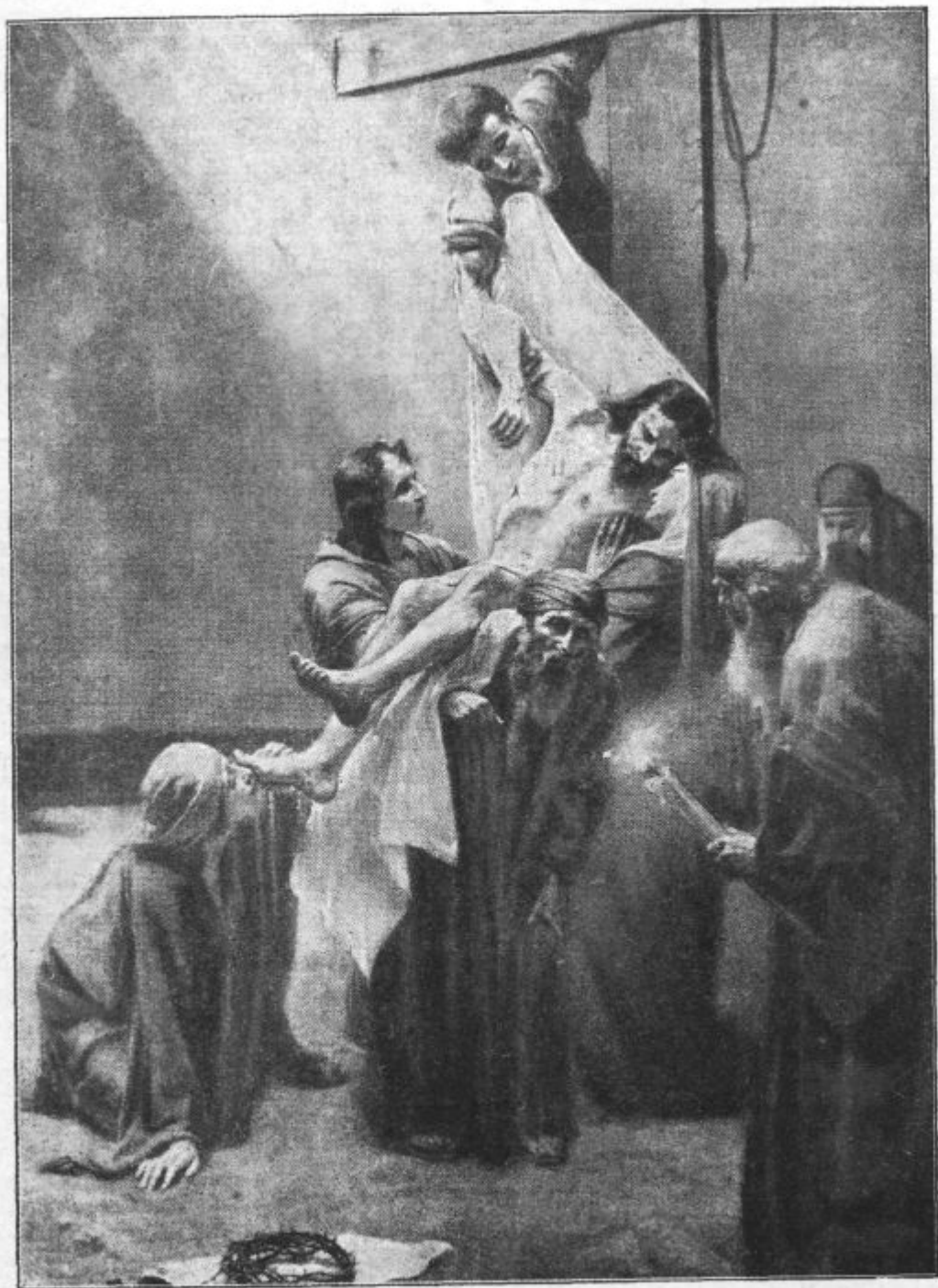
Ranjen je bil zavljo naših grehov, strt zavljo naših hudobij.