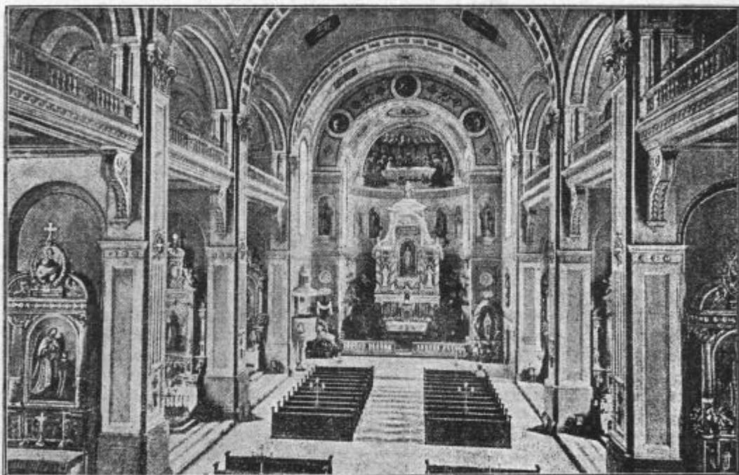
Cerkev Jezusovega Srca v Zagrebu.

cah nas učijo g. župnik izpred oltarja, mi se pa zberemo okoli njih do 300 po številu, mladeniči, dekleta, pa tudi šolarji, s katerimi imajo g. župnik še posebej vaje v šoli. Da pa tega, kar smo se v nedeljo naučili, med tednom ne pozabimo, ampak se še bolj naučimo vsi, za to ima skrbeti odbor pevskega odseka, ki zbira tudi med tednom ljudi k pevskim vajam; vsaka odbornica v svojem manjšem okolišu. Vse to se vrši seveda pod strogim nadzorstvom. V nedeljo pa zopet najprej ponavljamo. Tako smo se naučili dosedaj že 35 pesmi, predvsem blagoslovne, pred pridigo in Marijine, ki jih pojemo že tudi pri službi božji. Ko se bomo naučili bolj znane, preidemo