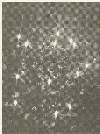
Žareče, kot otroške oči