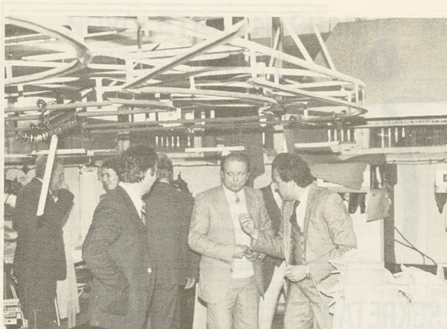
Razmislimo o vsem

Ljudem morate dati možnost, da odkrito povedo, kaj mislijo. Hkrati naj delavec ve, o čem odloča, da se bo ponašal kot dober gospodar. — Cilj samoupravljanja je tudi večji dohodek, v kar mora biti vpeta vsa hiarhija delovne organizacije."