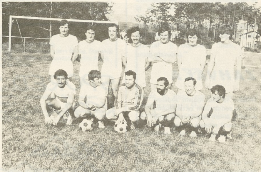
Dekleta in žene, zakaj samo moške in fantje?

zehamo in se pretegujemo za strojem. Kar priznajmo, da nas zbada v križu, da se nam mnogokrat ne ljubi pritrditi vijaka ali pobrati šivanke, če nam