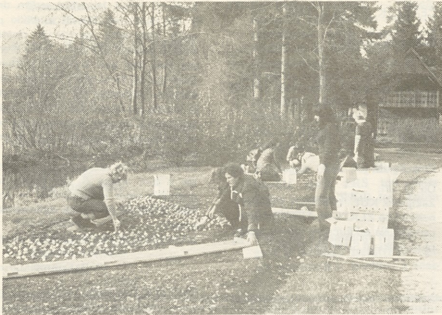
Delo v naravi nam koristi

padе na tla. Vse mišice postanejo trde in lene. Pravimo pač, da to pri- naša zima. Pa ni tako. Krivi smo sami, ker smo opustili vse to kar počnemo poleti. Poleg delovnih dolžnosti gremo še na morje, igramo nogomet, košarko, kolesarimo, plavamo, mnogi zahajamo v gore . . . . .