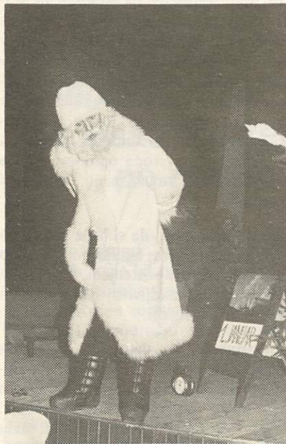
DOBER DAN, OTROCI

Vsako leto čaka naše otroke presečenje, vsako leto pričakujejo izpolnitev tistega, kar so si na tihem želeli. Zaradi daril DEDKA MRAZA so bili pridni v šoli, pomagali mamicam, ubogali očete, niso jezili babic in dedkov. Toda to je bilo le zadnji mesec, saj prej je bilo še prezgodaj, da bi naši nadobudneži to vzdržali, saj smo jim morali tu in tam še zadnji trenutek določene pregrehe odpustiti.