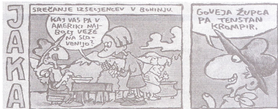
/Gorenjski gles, Kranj, julijs 2006 leta/

Organizatorji so poskrbeli, da nihče ne ostane lačen. Za vse je bilo dosti grilanega mesa, klobas, čevapčičev, pijače. Vsak je dobil žeton za jed in pijačo in si je zbral, kar je hotel. Vreme nam je bilo naklonjeno in v naravi nam je bilo zares lepo. Kratek ogled Bohinjskega jezera, hrepeneči pogled na Vogel in ostale vrhove... Dan smo končali s