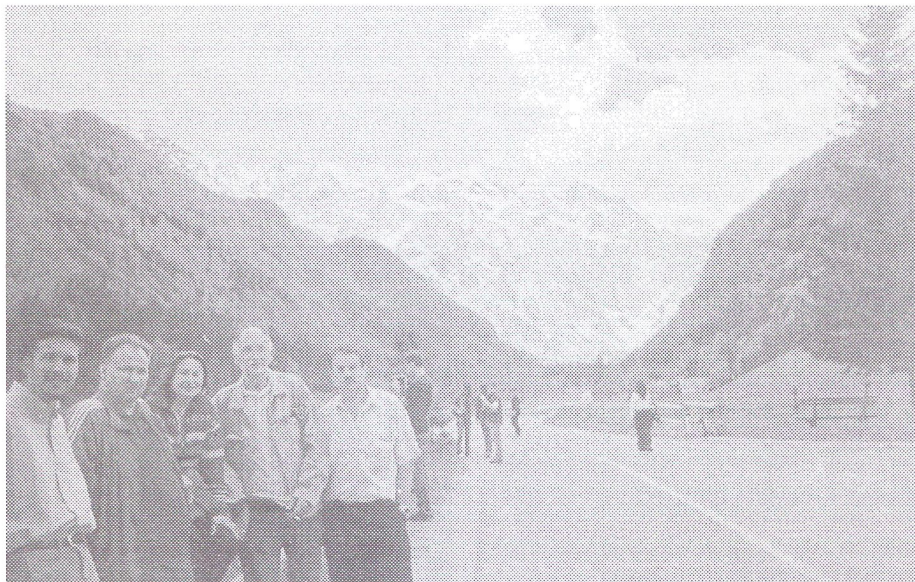
Vhod v Logarsko dolino

Poleg planinskih pejsažev in širokih vidikov na Alpe,