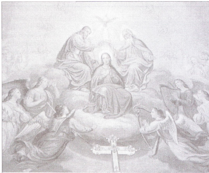
Cerkev Sv. Miklavža Bohinjska Bistrica