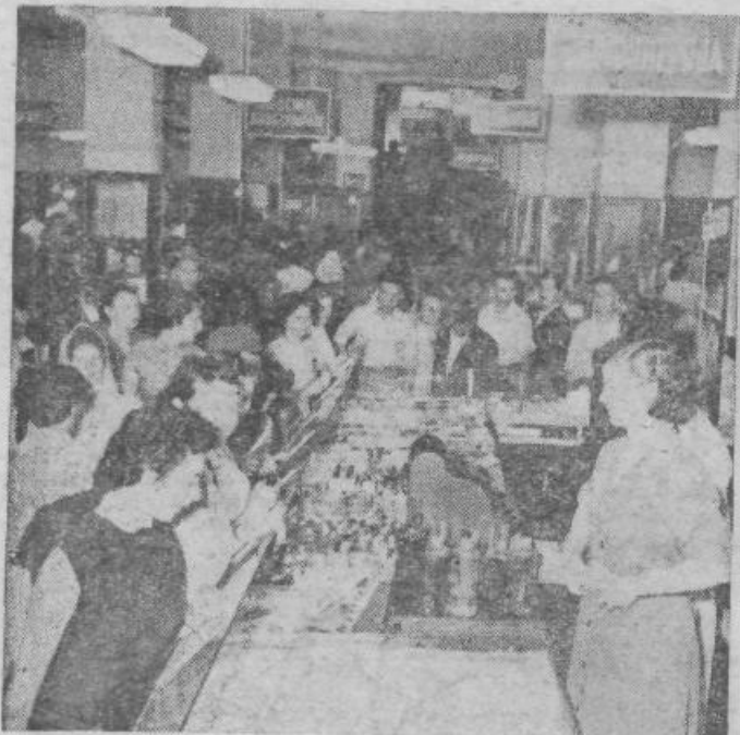
Na zborih volivcev po mestih se pogosto razpravlja tudi o delu trgovin