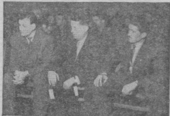
Z nekega zbora volivcev v Beogradu

Prvič, dejstvo je, da so v dosedanjih praksi doslej prišli bolj do izraza zbori volivcev na vasi kakor v mestu. Zato je v neki meri tudi nekaj objektivnih vzrokov, kakor so na primer elementi tradicije, to je sklepanja o odnosih na vasi na zboru državljanov, kakor tudi zaradi bolj omejenega družbeno-političnega življenja na vasi. V mestu pa je družbeno-politično življenje, ki se razvija po zelo široki in razvejani mreži raznih družbenih organizacij, katere zajemajo znatno število državljanov, mnogo bolj zapleteno in izdiferencirano. V Kraljevu (mesto, ki šteje 20.000 prebivalcev) je na primer okrog 40 raznih družbenih organizacij in združenj, v katerih je vključenih nad 8000 državljanov. V večjih mestih je družbeno življenje v tem pogledu še bolj razvito. Čeprav družbena aktivnost teh organizacij ne more v nobenem primeru nadomestiti take oblike sodelovanja državljanov pri reševanju javnih poslov kakor tudi vprašanja družbeno-politične kontrole dela organov oblasti, vendar te organizacije s svojo družbeno aktivnostjo imajo določen družbeni vpliv na reševanje nekaterih