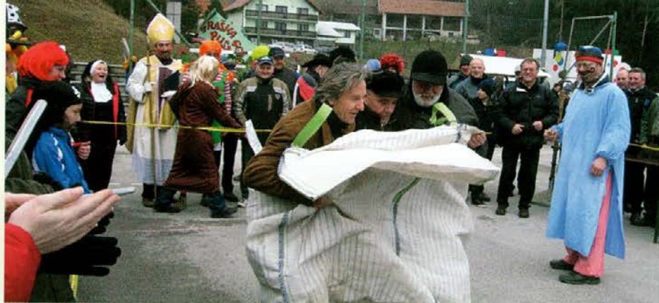
Tudi oba župana iz Mislinjske doline in podžupan iz Velenja niso bili od muh.