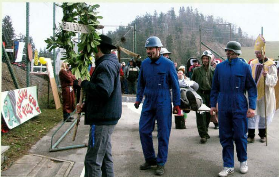
In še pokop pusta ob koncu prireditve

teka v big-bag vrečah. Zmagala je ekipa Slovenj Gradca, ki je na koncu prekosila ekipo iz Mislinje in Velenja, v spretnosti skupnega teka v vrečah pa sta se predstavila tudi župana Mestne občine Slovenj Gradec in Mislinja ter podžupan Mestne občine iz Velenja. Ob koncu prireditve so organizatorji predstavili še pokop pusta in se povseselili na družabnem srečanju v gostišču Plazl na Graški gori.