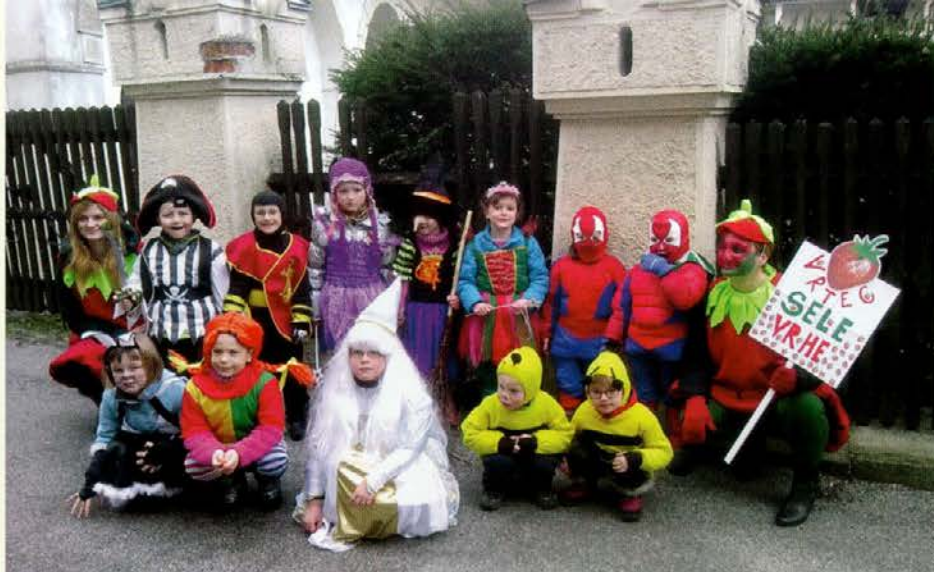
Pa na svidenje spet prihodnje leto, pustki hrustki.

Pa so zopet mimo dnevi norčavosti in pustnih šem. Veliko nas je takih, ki stežka čakamo, da se lahko za trenutek skrijemo za masko in postanemo nekdo drug. Še bolj zanimivo je opazovati reakcije ljudi okrog nas, ki nas ne prepoznajo. Nekateri v zadregi brskajo po glavi, kdo neki stoji pred njimi, drugi pa pokažejo svoj boljši ali pa tudi slabši, a vendar resnični "jaz".