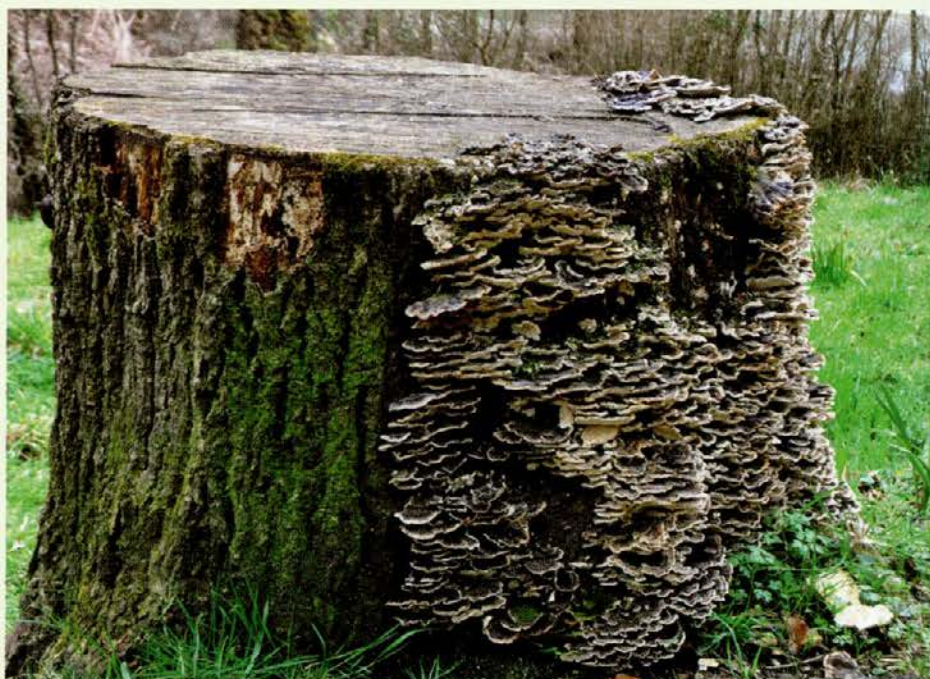
Glive bodo les pretvorile v rastlinsko hrano.

Najbližja asociacija za glive so običajno gobe. Goba predstavlja le mesnati, nadzemni del glive, večina pa se je skriva pod zemljo v obliki tankih nitk, imenovanih micelij. To seveda ni edina oblika gliv. Že na svojem telesu najdemo izjemno pestro paleto različnih gliv; samo na nogah jih bojdaj živi kar 80 vrst. Glive so v naravi nepogrešljive, saj so prave kemične tovarne. Iz neuporabnih snovi predelujejo hrano. "Odgovorne" so za razgrajevanje odmrlih organizmov oz. njihovo reciklažo, saj na ta način sprostitjo hranilne snovi, da so te na razpolago rastlinam. V obliki sožitja, imenovani mikoriza, so glive pritrjene