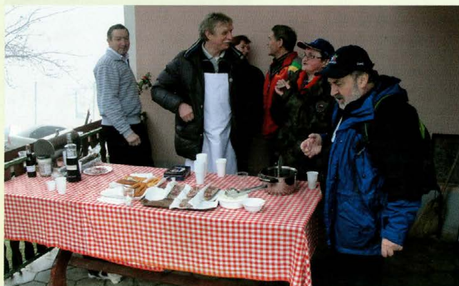
Prileže se nekaj toplega.

Torej, kaj smo si mogli, zaščitili smo se, kolikor se je pač pred močnim dežjem dalo, in zagrizli v breg nad postajo. Pot so letos označili nekoliko drugače, saj je bilo nad Skalo v Dravogradu podrtega toliko drevja, da tam čez ni bilo varno. Tako smo pod vrh prišli pod Vinklarjevo domačijo, nato pa nadaljevali po običajni trasirani Šisernikovi poti.