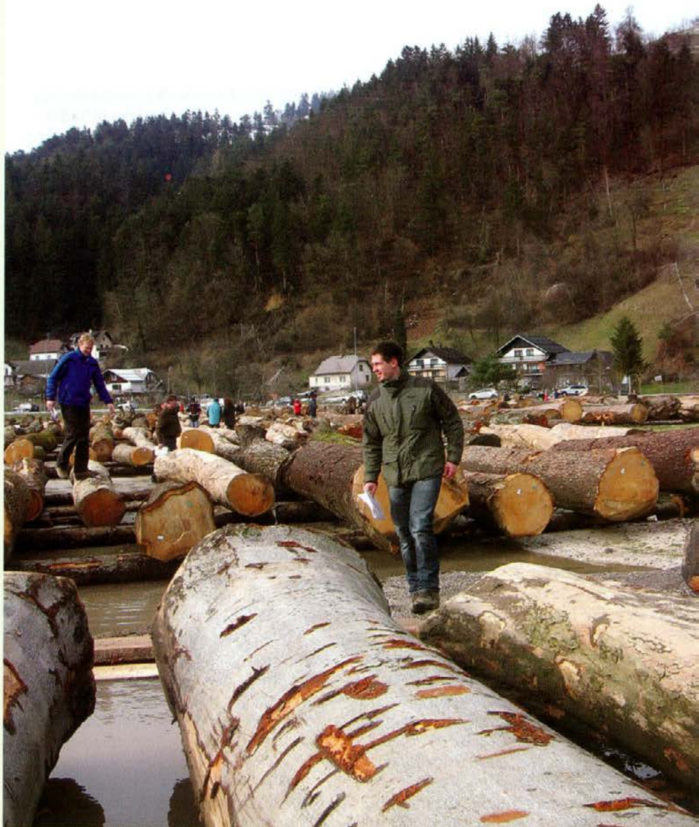
Na licitaciji vrednega lesa 12. 2. 2014 v Slovenj Gradcu

Najkrajši mesec v letu je za nami. Letošnji februar je bil namenjen pustnim norčijam. Gozdarjem in lastnikom gozdov pa je bilo minuli mesec bolj malo do norčij kljub vsemogočim norostim, ki se dogajajo okoli nas. Za zaskrbljenost je bila odgovorna narava, ki je poskrbela za ledeni tuš. Že 31. januarja se je začel kopičiti na drevju v gozdovih in sadovnjakih po vsej Sloveniji, razen na Primorskem in v Prekmurju, žled. Žledenje se je intenzivno nadaljevalo vse do 4. februarja. Žled je povzročil veliko težav in škode tudi v gozdnogospodarskem območju Slovenj Gradec. Z ledom obdano drevje se je začelo lomiti in podirati, poškodovani so tudi mlajši sestoji. Zaprte so bile številne ceste, veliko zaselkov in kmetij je bilo teden in več dni brez elektrike. Na terenu so se srečevali in odpravljali posledice ledene ujme gasilci, gozdarji, lastniki gozdov in električarji.