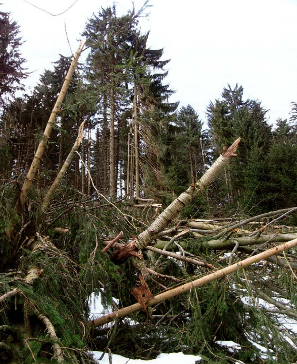
Žledolom v Gnamuševem gozdu v revirju Trbonje, 26. 2. 2014

ocenitev poškodovanosti gozdov po parcelah, ki je namenjena predvsem za razglasitev žleda kot naravne nesreče in je podlaga za pridobitev evropskih proračunskih sredstev. Lastniki gozdov, ki jim je na parceli gozdnega zemljišča žled v celoti uničil gozd in jim je ZGS naložil obvezno obnovo gozda s sadnjo ali je nujna sanitarna sečnja v obsegu, večjem od 50 % desetletnega mogočega poseka, in so oddali na občini vlogo za prijavo škode do 12. februarja 2014, bodo deležni davčnih olajšav. Podatki o ocenitvi poškodovanosti gozdov po žledu bodo služili tudi za načrt sanacije po žledu poškodovanih gozdov, ki so osnova za pridobitev dodatnih republiških finančnih sredstev za sanacijo. Možne bodo tudi davčne olajšave za zelo poškodovane gozove na posameznih parcelah.