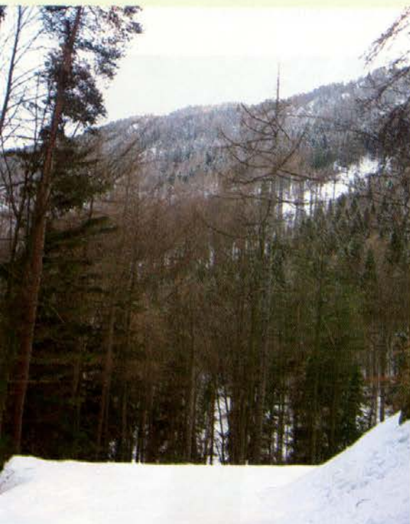
V Kozarnici pod Uršljo goro žleda ni bilo, 24. 2. 2014.

na Koroškem in Prevalje skupaj 55.052 m 3 ), v KE Črna 18.148 m 3 in v KE Radlje 17.018 m 3 . Ocenjena površina vseh poškodovanih gozdov je 25.000 ha. Velik del poškodovanega drevja je že označen za posek. Za poškodovane dele gozda, kjer je varnost izvedbe zaradi podrtega drevja zelo ogrožena, so revirni gozdarji na osnovi odkazila na vzorčni ploskvi ocenili količino poškodovanega drevja v odseku. Gozdarji javne gozdarske službe so in še bodo izdali lastnikom individualne odločbe z označeno in izmerjeno količino poškodovanega drevja ali individualno odločbo z oceno poškodovanega drevja. Zaradi nevarnosti prekomerne razmnožitve podlubnikov (veliki in mali smrekov lubadar) je rok za posek iglavcev do 15. maja 2014. Rok za posek listavcev je lahko tudi do 31. 12. 2016. Priporočamo, da listavce posekate prej ali istočasno z iglavci. Ocena poškodovane količine lesa po odsekih je tudi osnova za