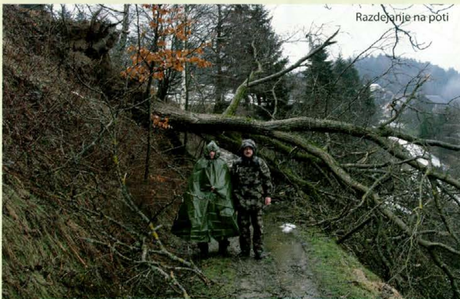
Razdejanje na poti

polomljene vrhove predvsem mladih smrek; spominjale so me na mlada življenja. Če se tudi ljudem v mladosti zgodi huda nesreča, oni ozdravijo, drugi pa morda več nikoli. Tako bo tudi