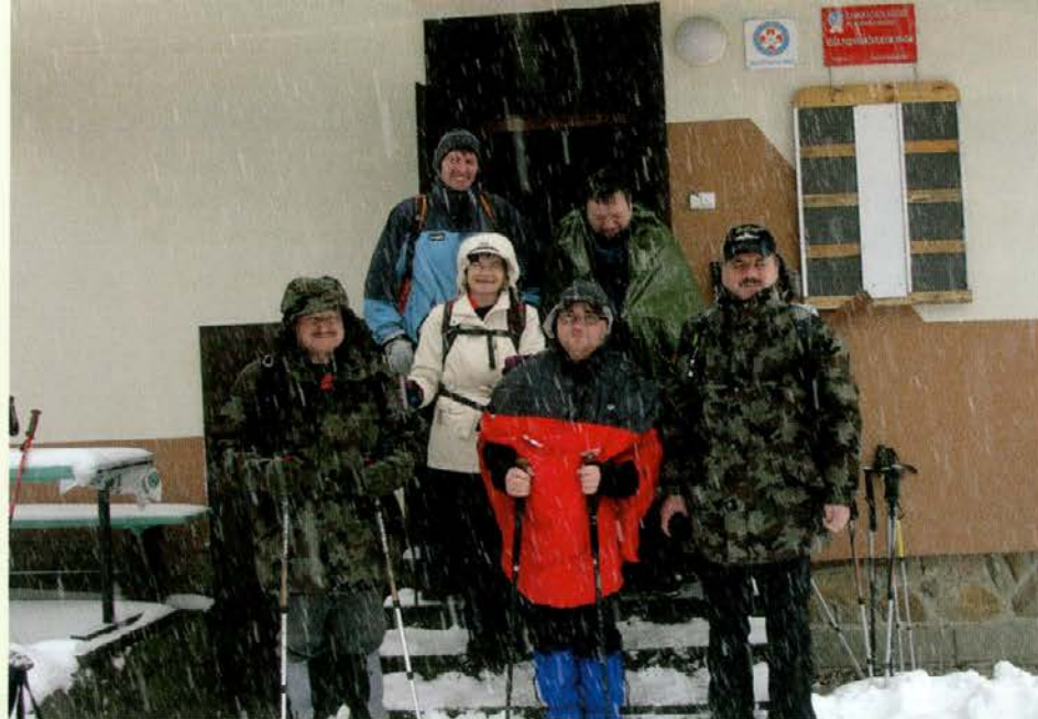
Nič nas ne ustavi!

so se pa zmotili, mogoče bo pa deževalo šele popoldan. Do takrat bomo pa že prehodili toto Šisernikovo." Pa je to bila le bolj samotolažba, ob pol sedmih, ko sem se odpravljaj na pot, je že vztrajno rosilo, nebo pa je bilo zabulano , kot včasih rečemo. Ob sedmih, ko smo se zbirali nad železniško v Dravogradu, pa se je močno vlilo, kot da bi nas hotelo odvrniti od nameravane poti. "Mogoče bo pa prestavljen ta pohod, ko tako močno dežuje ..." se je spraševal eden od pohodnikov. Pa ga je kaj hitro drugi popravil: "Ne, ta pohod je vedno zadnjo soboto v februarju, ne glede na vreme. O, smo že gazili, pa še kako, pa ni bil prestavljen."