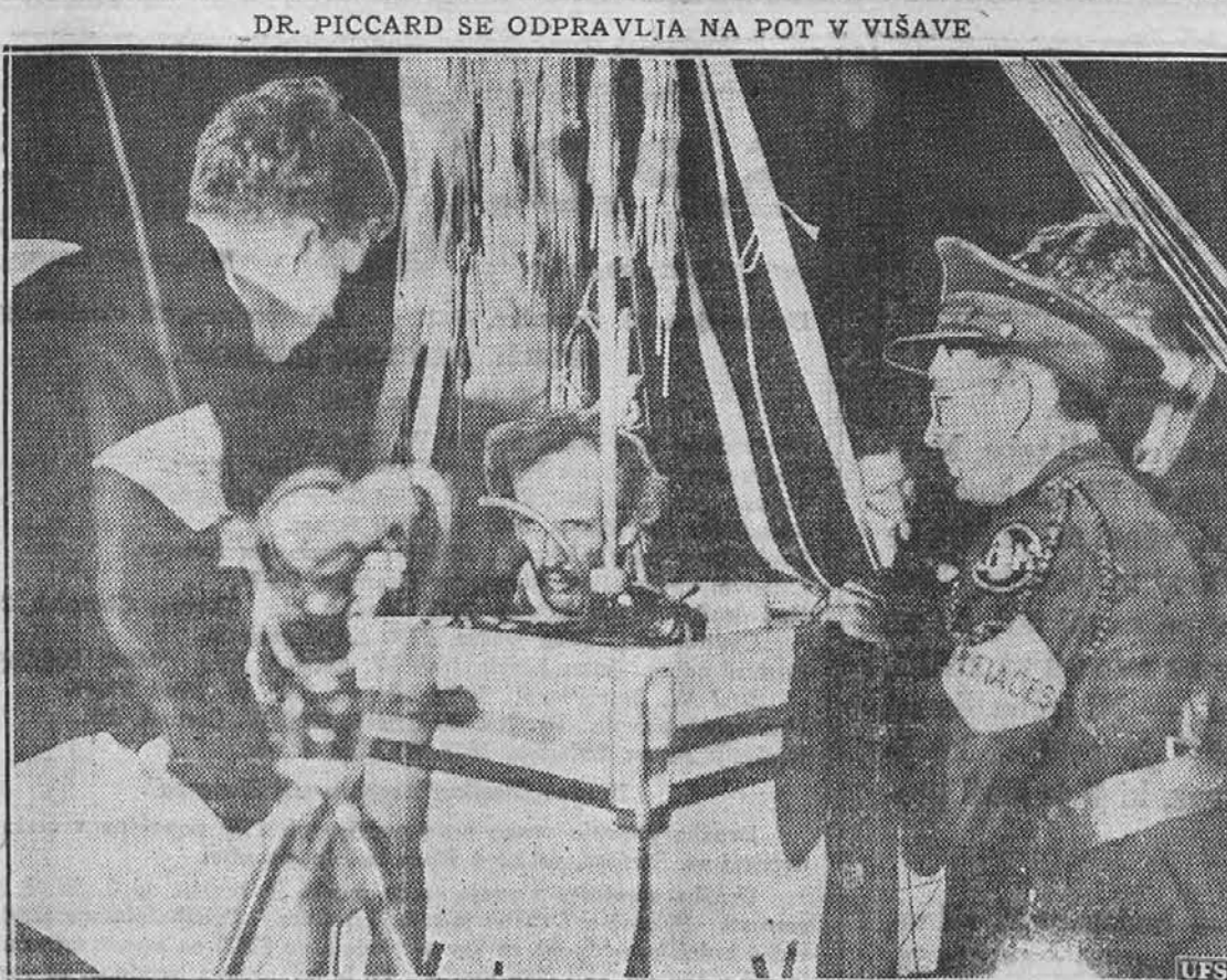
DR. PICCARD SE ODPRAVLJA NA POT V VIŠAVE Dr. Jean Piccard, sloviti belgijski raziskovalec stratosfere, se zapira v gondolo, katero je dvignilo v višave 80 malih balunov v Rochester, Minn.

Krompirjeve omelete Dva funta opranega olupljenega krompirja (sirov krompir) zribaj na ribežnu. Zribani krompir deni v moko in otisnjeno krpo in ga dobro ožmi. Voda, ki jo da krompir, naj še nekaj časa stoji, da se škrob vsede. Kar je čiste vode, jo odlij, škrob pa zlij h krompirju. Krompir stresi v skledo in primešaj rumenjake in eno jajce, šest žlic kisle smetane, tri žlice moke in malo soli. Ko je vse skupaj dobro zmešano, primešaj sneg enega beljaka. V kozl za omelete raz-