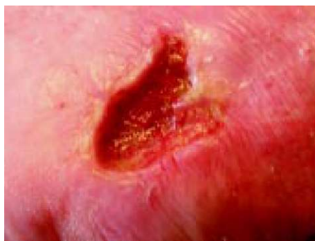
Sl. 6. Venska golenja razjeda dne 1. 3. 2006.