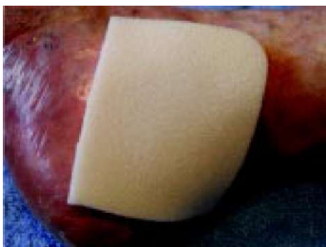
Sl. 2. Silikonska poliuretanska pena.

VGR je bila po šestih dneh večja, globlja, obložena s fibrinskimi oblogami in obilnim zelenim izločkom, okolica pordela (Sl. 3), velikost 3 cm x 3 cm. O stanju rane je bila zaradi poslabšanja, obilnega zelenega izločka in bolečin obveščena pacientkina osebna zdravnica, ki je predpisala sistemski antibiotik in hidrokolooidno oblogo iz hidrofiber (Sl. 4), z menjavo na 2 do 3 dni.