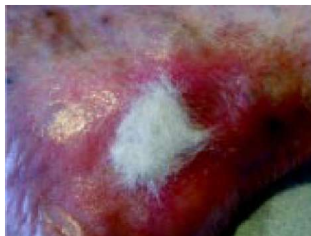
Sl. 5. Alginatna obloga.

Dne 24. 2. 2006 je imela pacientka kontrolni pregled na dermatološki kliniki. Po navodilu dermatologinje se je od takrat dalje na rano aplicirala alginatna obloga (Sl. 5) z menjavo na 2 do 3 dni. Kot sekundarna obloga je bila nameščena vpojna nelepljiva obloga. V rani so bile 1. 3. 2006 (Sl. 6) vidne manjše gra-