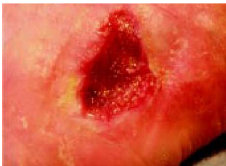
Sl. 1. Venska golenja razjeda dne 9. 2. 2006.

VGR je bila 9. 2. 2006 čista, brez fibrinskih oblog, z obilnim izločkom (Sl. 1). Toaleta rane se je izvajala z blagim, tekočim milom in tuširanjem s toplo tekočo vodo, okolica rane pa mazala z 10-odstotnim olivnim oljem v belobazi. Po navodilu dermatologinje se je na rano aplicirala silikonska poliuretanska pena z menjavo na 2 do 3 dni (Sl. 2).