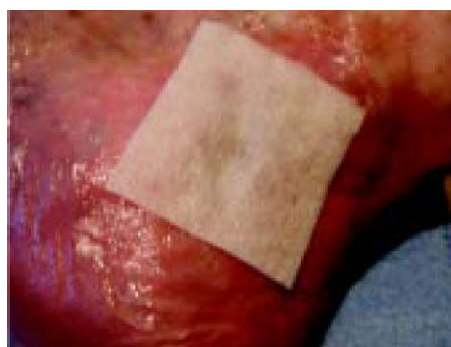
Sl. 4. Hidrokolooidna obloga iz hidrofiber.

VGR se je po enem tednu aplikacije hidrokolooidne obloge iz hidrofiber in jemanju sistemskega antibiotika zmanjšala, okolica je bila brez vnetnih znakov, manj je bilo bolečin, izcedek je bil rumeno-rjave barve in še obilen. Nad obstoječo razjedo se je dodatno pojavila manjša ranica.