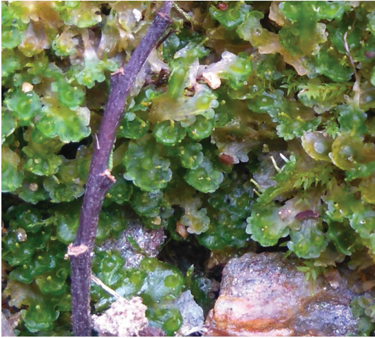
Slika 1: Vrsta Blasia pusilla L. na nahajališču na Ruškem Pohorju. Uspeva v šopih na kamniti podlagi z malo humusa, 9. 1. 2018.

Figure 1: Blasia pusilla L., Ruško Pohorje. Grows in tufts on rocky ground with shallow humus layers, 9. 1. 2018. (Photo: Žan L. Cimerman).