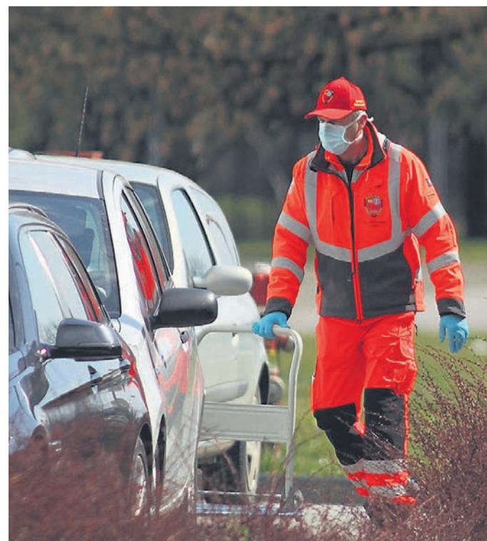
Delavec Zdravstvenega doma v popolni zaščitni obleki skrbi za dostavo sanitetnega materiala.