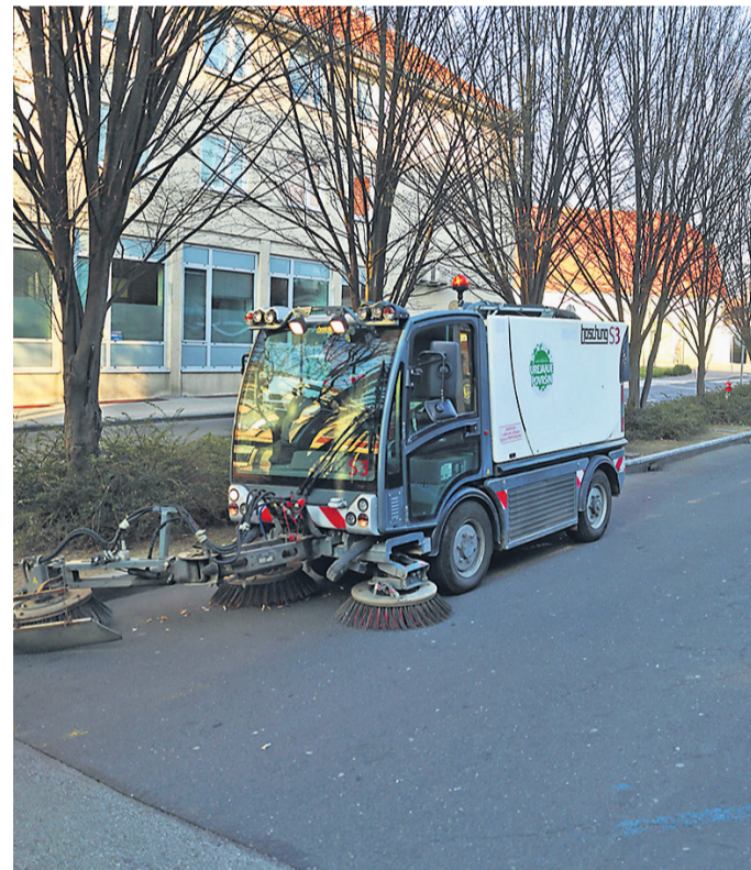
Med tistimi, ki (še) delajo, so tudi komunalni delavci.