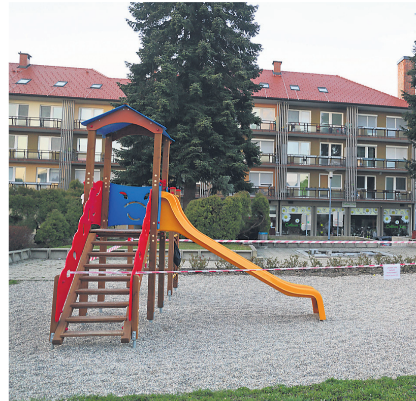
Ormoška otroška igrišča samevajo.