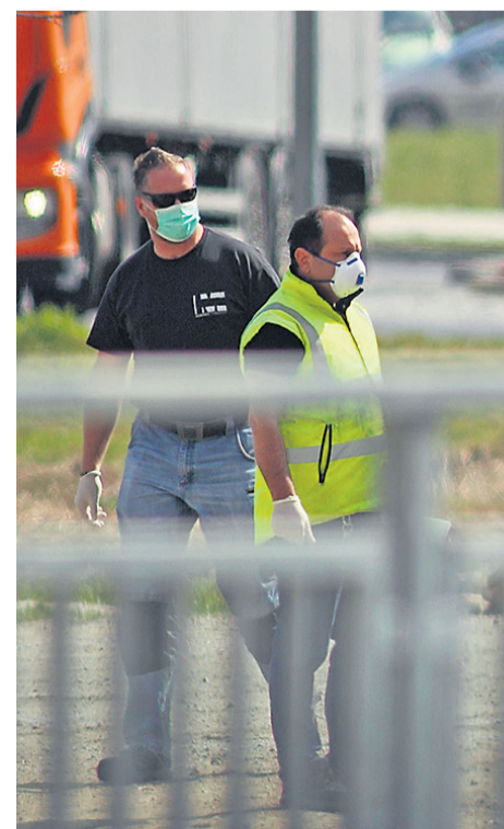
Delavci v slovenjebistriškem Impolu so že