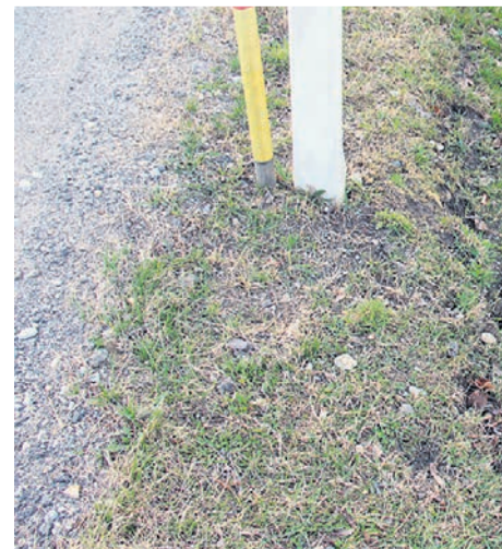
Na tem mestu je stal prometni znak – dokler ga ni izruval.