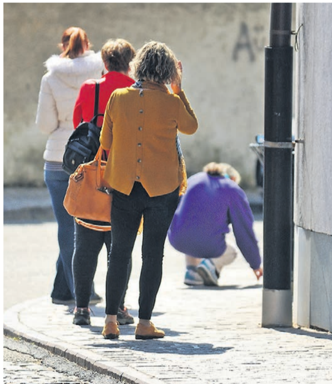
Vrsta pred vrati Pošte na Ptuj