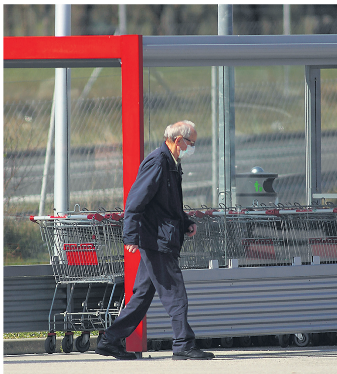
Slovenska Bistrica: niso (več) tako redki tisti, ki se v trgovino odpravijo z zaščitno masko na obrazu.