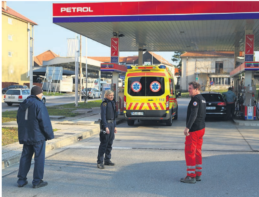
V Ormožu je bilo sredi tedna v mestu videti le tiste, ki morajo delati: zdravstveno osebje in policiste.

Tisti, ki še delajo, so skriti za tovarniškimi zidovi in ograjami. Le gradbince je še videti na kakšnem delovišču. Pred »šihom« ali po njem ne morejo več na kavo ali zasluženo pivo, pa so verjetno obojega potrebni. Delajo, dokler še lahko.