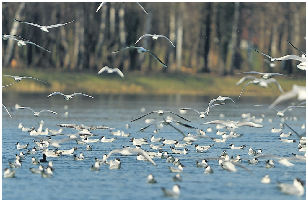
Na gladini reke Drave in Ptujskega jezera sredi marca prenočuje tisoče in tisoče rečnih galebov. Območje so si ptice izbrale kot postojanko na selitveni poti od juga proti severu Stare celine.

Kot je še pojasnil sogovornik, je število ptic na Ptujskem jezeru tako zgoščeno predvsem zaradi skupinskega prenočevanja. »Značilnost galebov, pa tudi nekaterih drugih vrst vodnih ptic, je, da se v večernih urah zberejo na skupinskih prenočiščih. Običajno izberejo večje vodne površine, kjer so varne pred plenilci. V sredini marca lahko zbiranje večje množice rečnih galebov opazujemo na delu Drave skozi Ptuj in zgornjem delu Ptujskega jezera, medtem ko prenočujejo na spodnjem, najširšem delu jezera. V času viška selitve število ptic na prenočišču vselej doseže nekaj tisoč rečnih