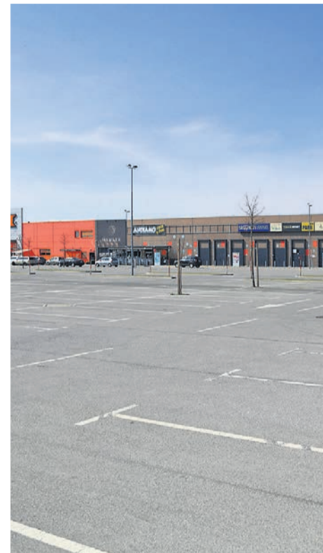
Pogled na parkirišče pred ptujskim Qcentrom