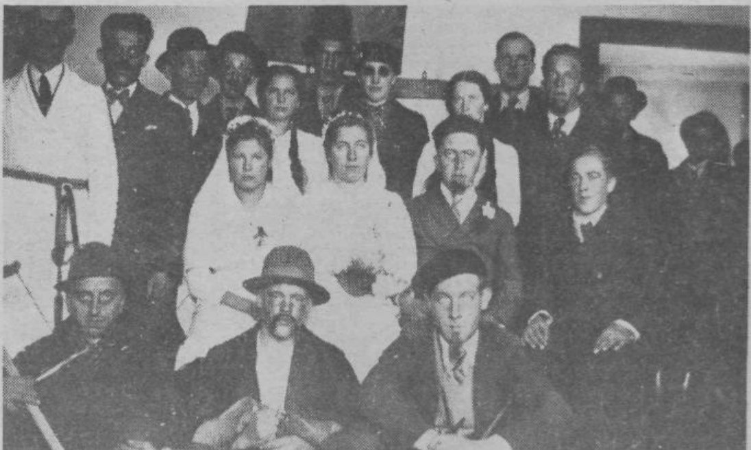
Gledališka skupina iz Javora, ki je pred 35-timi leti uprizorila komedijo Lumpacius Vagabundus

Takoj po vojni pa se je gledališka skupina – sedaj kot KUD France Prešeren – ponovno formirala in postavlja vsako leto na oder dve do tri predstave – žal zadnji dve leti le po eno. Sodeluje tudi na reviji gledaliških skupin naše občine ter gostuje v sosednih krajih. Gledališka skupina v Javoru ima 43 delovnih članov, kar je pokazala tudi letošnja revija, ki se je zaključila v njihovem kraju. To je tudi garancija za njihovo nadaljnje delo. Ob njihovem jubileju jim vsi od srca čestitamo, posebno še druge gledališke skupine občine Moste-Polje, in jim želimo nadaljnega uspešnega dela.