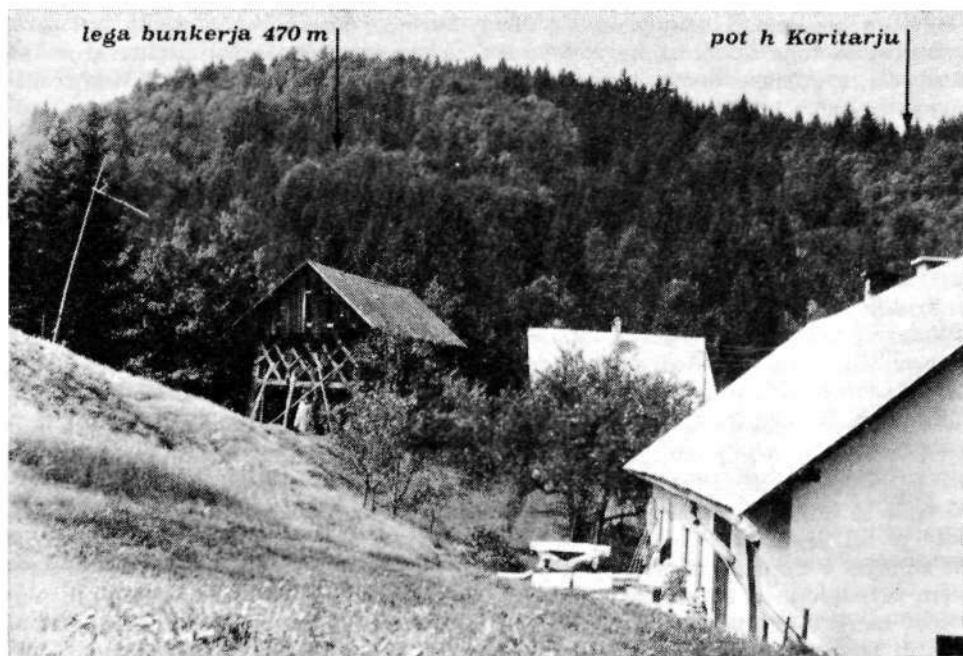
Jagaršnikova domačija (454 m) nad Srednjo vasjo danes.