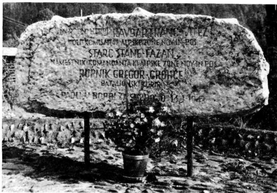
Spomenik padlim borcem v prvi tehniki Poljanskega bataljona v Logah ob cesti v Srednji vasi.