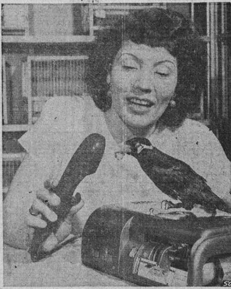
Talking mynah bird "bones-up" on his vocabulary and improves his diction.

NEW YORK — A small bird that meows like a cat, barks like a dog, whistles at pretty girls and conducts a fairly intelligent conversation — at least as intelligent as anything you are likely to hear at a cocktail party — has become the latest "rage" in household pets.