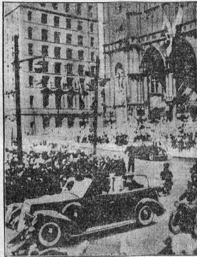
Angleška kraljevska dvojica v Montrealu v Kanadi.

* Savinjski hmeljarji niso nič kaj zadovoljni z novo določbo, po kateri naj bi se njihov hmelj odslej imenoval »štajerski hmelj«. Doslej se je uradno znanokoval s »savinjskim hmeljem«. Na ostalem štajerskem proizvajajo tudi hmelj, ki pa ni tako dober kot savinjski. Stori bodo korake, da se savinjski hmelj uradno imenuje tako kakor prej.