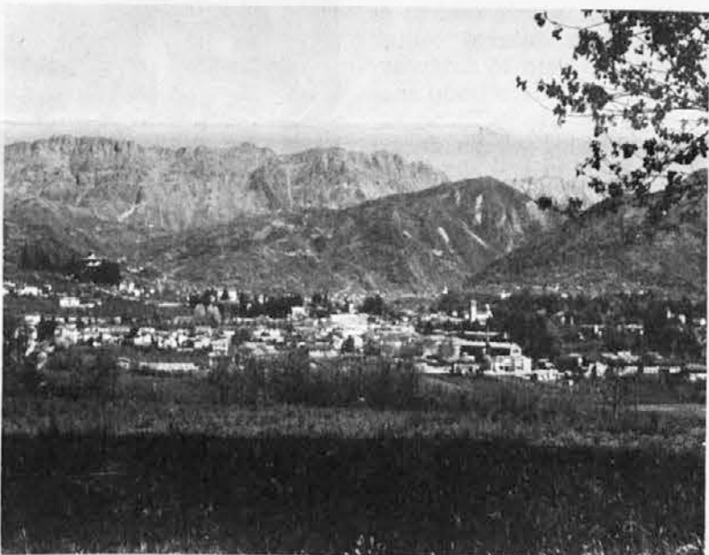
Centu ali Tarčent leži tik ob vходу v Tersko dolino in je prav prijetna izletniška točka. Od Vidma je oddaljena 20 kilometrov

Razmišljamo o motivih, da bi lahko napisali kaj veselega in obetajočega o življenju v naši vasi, Šteli /Stelli/ nad Tarčentom, tem «biserom Furlanije». Na primer o kakem rojstvu, pa novi ali obnovljeni domačiji, in morda o zanimivi pobudi za gospodarski razvoj vasi in sosednjih zaselkov, ki leže na prijaznih gričih ob skrajni zahodni meji našega slovenskega jezika.