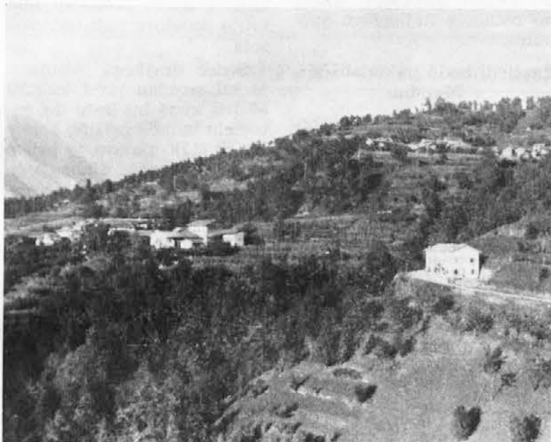
Vasica Stela, ki leži visoko v strmih bregu nad Cento, se neverjetno izpraznjuje, kajti življenje je tu iz dneva v dan bolj trdo

Naše matere in gospodinje morajo hoditi po pitno vodo poldrug kilometer daleč - Neizpolnjene obljube o gradnji krožne ceste, ki bi povezovala najbolj zahodne vasi slovenskega jezikovnega območja