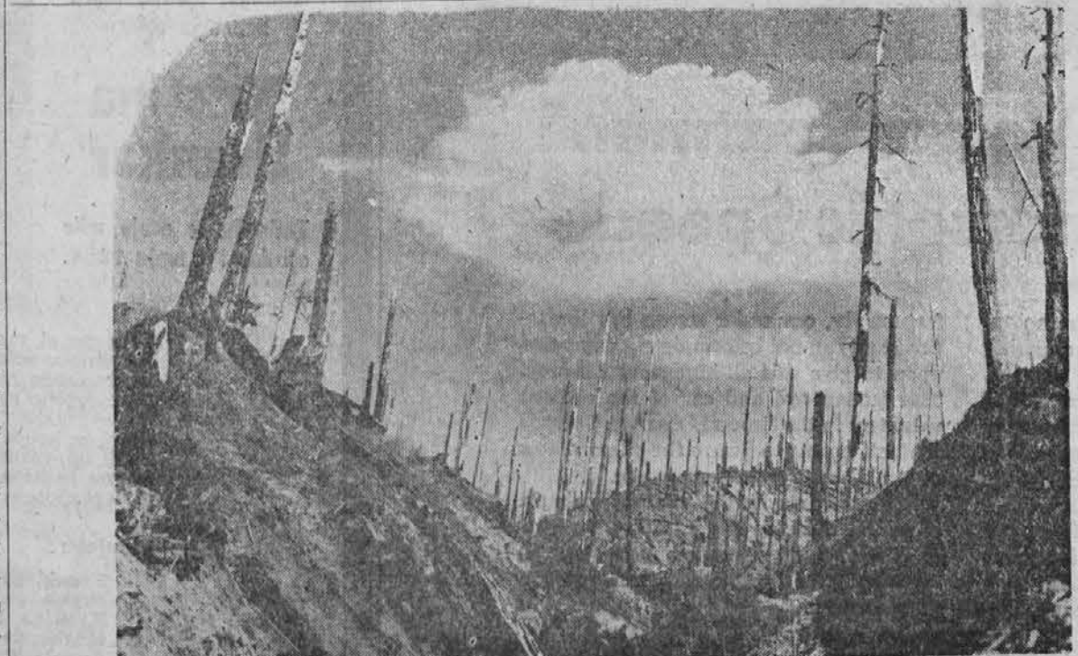
AMERICAN TRAGEDY —You can see wherever you go in America . . . acre upon acre of black snags . . . the aftermath of fire. Gone for years are recreational areas, wildlife, valuable timber and watersheds. This shameful waste must stop. Be extra careful this year. Be careful with every fire. Remember—only you can prevent forest fires. This message sponsored by:

PREPARE YOUR HOME AGAINST DISASTER! YOUR DRUG COUNTER HAS OFFICIAL DISASTER FIRST-AID SUPPLIES