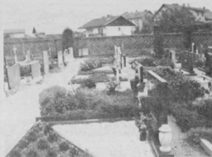
Pokopališče na Vidmu je res lepo urejeno.

ob cesti, smo pa naleteli na kakšno zelo neurejeno staro stavbo. Hiše v bližnji okolici so v glavnem nove, z lepo urejenimi zelenicami. Med zanimivostmi kraja je gotovo na prvem mestu cerkev iz dobe romantike; dograjena je bila leta 1445. Za cerkvijo, na