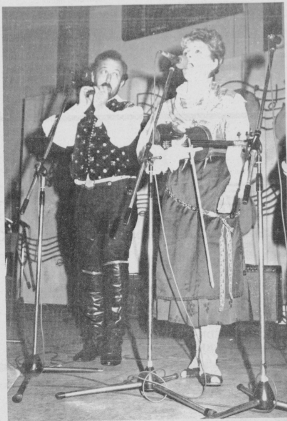
»Glasba iz Slovenije ...«

v petek, 7., in soboto, 8. septembra, ob 20. uri — v nedeljo, 9. septembra, ob 17. uri v dvorani Srednješolskega centra