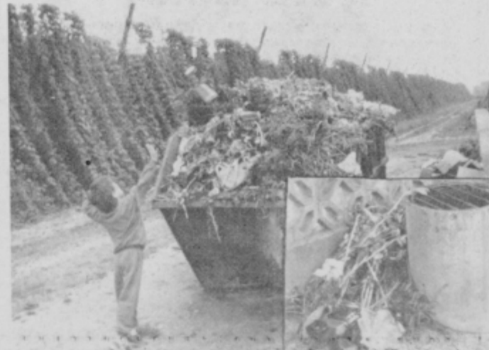
Poln zabojnik, smeti pa tudi ob vodovodu.