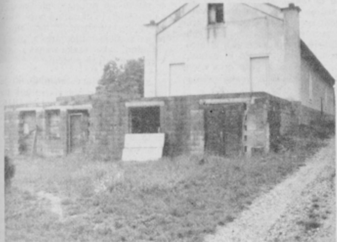
Prizidek za dvorano dobiva »brado«.

bolj spominja na trg. Predvsem tranzitni trg, saj v kraju ni nič takega ali pa je malo takega, da bi popotnika pritegnilo in ga za nekaj časa zadržalo. Samo središče je nekako utesnjeno v zidovih, čeprav je treba priznati, da je videti tudi nekaj zelenja, celo urejeno je bilo v času našega obiska.