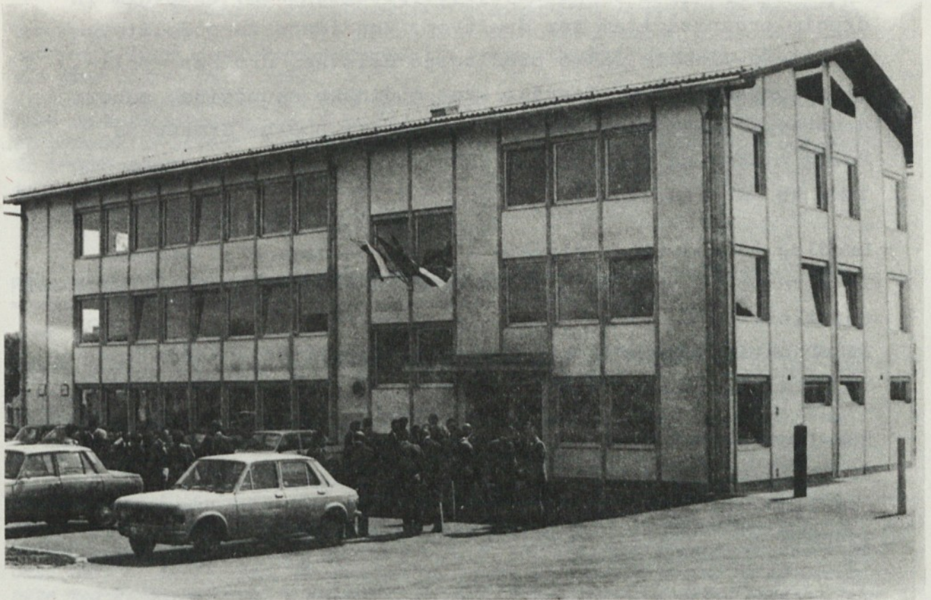
(Na posnetku: otvoritev objekta)

KOMUNALNO PODJETJE GROSUPLJE V NOVIH PROSTORIH CESTA NA KRKO 7, GROSUPLJE. V TE PROSTORE SE JE PRESELILA TUDI SLUŽBA KOMUNALNEGA SKLADA OBČINE GROSUPLJE ZA UREJANJE IN ODDAJANJE STAVBNIH ZEMLJIŠČ.