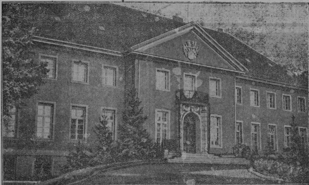
Grad Neudeck v Prusiji, kjer je umrl predsednik Nemčije maršal Hindenburg

Živega mladega planinskega orla so ujeli v Podreznu pri Škofji Loki ob italijanski meji. Orel je napadel na dvorišču mačka, a so ga prepočili. Ostanke mačka so nastavili kot vabo in zraven zanjko. Ujeti orel meri z razprostrtimi peruti 170 cm in je pri nas redkost.