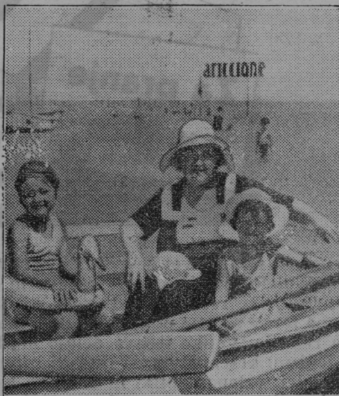
Žena rajnega dr. Dollfussa z otrokoma.

Prisilni pristanek potniškega letala v Halozah. Dne 3. t. m., ob 10. uri popoldne, je moralo radi napake v motorju prisilno pristati v vasi Kozminci v Halozah potniško letalo, ki obratuje na progi Dunaj — Gradec — Zagreb — Belgrad. V aeroplanu sta bila pilot in monter, ki sta ostala nepoškodovana. Letalo so pripeljali v Turnišče pri Ptuj in so telefonirali po strokovnjake na Dunaj, ki bodo imeli posla z motorjem dva dni.