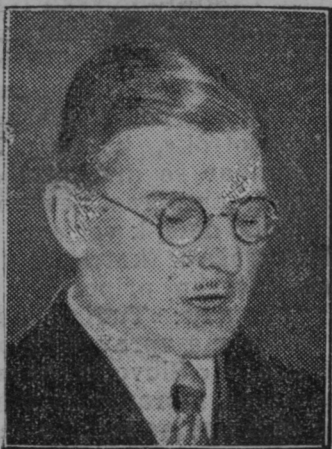
Novi avstrijski kancelar dr. Kurt Schuschnigg.

Da je nemškutarstvo dosledno hitlerjevsko usmerjeno, se je dokazalo o priliki julijske narodno-socialistične revolucije na Koroškem. Dočim so vsi slovensko-čuteči Slovenci na Koroškem ostali zvesti avstrijski državi in njeni zakoniti oblasti, so nemškutarji v velikem številu pohiteli med hitlerjevske puntarje. Čisto po stari nemškutarski metodi! S tem, da se je odtujil slovenstvu, je postal nemškutar neko bastardo bitje, ki je zgubilo moralno ravnotežje