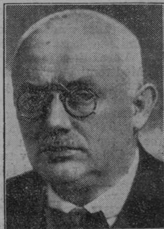
Dr. Rintelen, avstrijski poslanik v Rimu, ki je bil duša zadnjega upora v Avstriji.