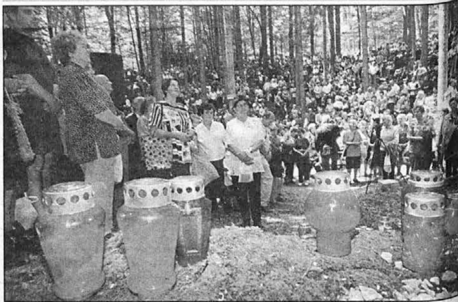
Med mašo pri jami pod Krenom v Kočevskem Rogu

Ob cerkvah je stalo stanovanjsko poslopje za klerike, vse pa je bilo obdano z obzidjem. Izkopano je bilo tudi grobišče. Ves kompleks je dvakrat pogorel, odločilno verjetno ob vdoru Slovanov okoli leta 580. po tem dogodku ga niso več obnavljali.