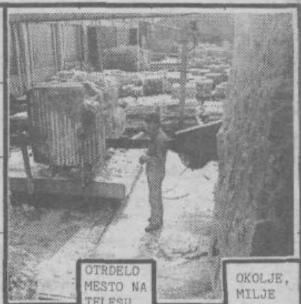
OTRDELO MESTO NA TELESU OKOLJE, MILJE