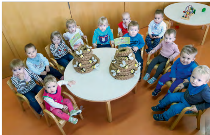
Otroci oranžne igralnice smo se igrali s čebelami in čebelnjaki.