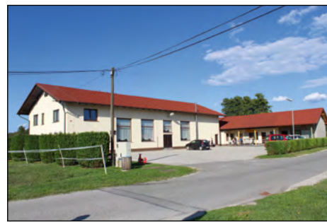
Vaška skupnost Skorba je letos osvojila največ točk komisije.