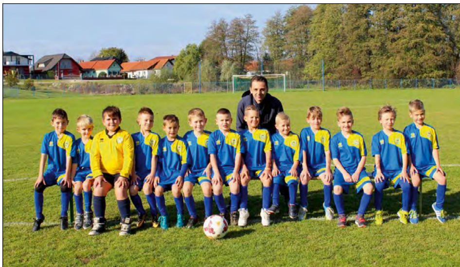
Mlajši cicibani U8