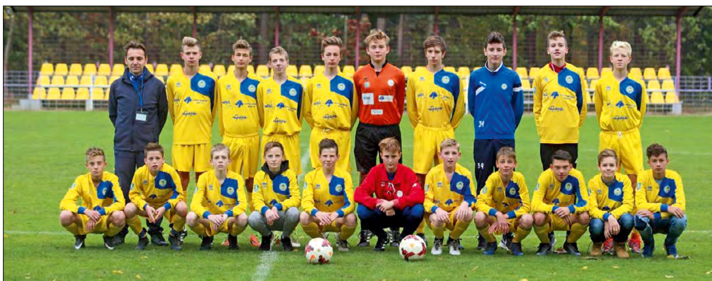
Starejši dečki U15 NZS in MNZ