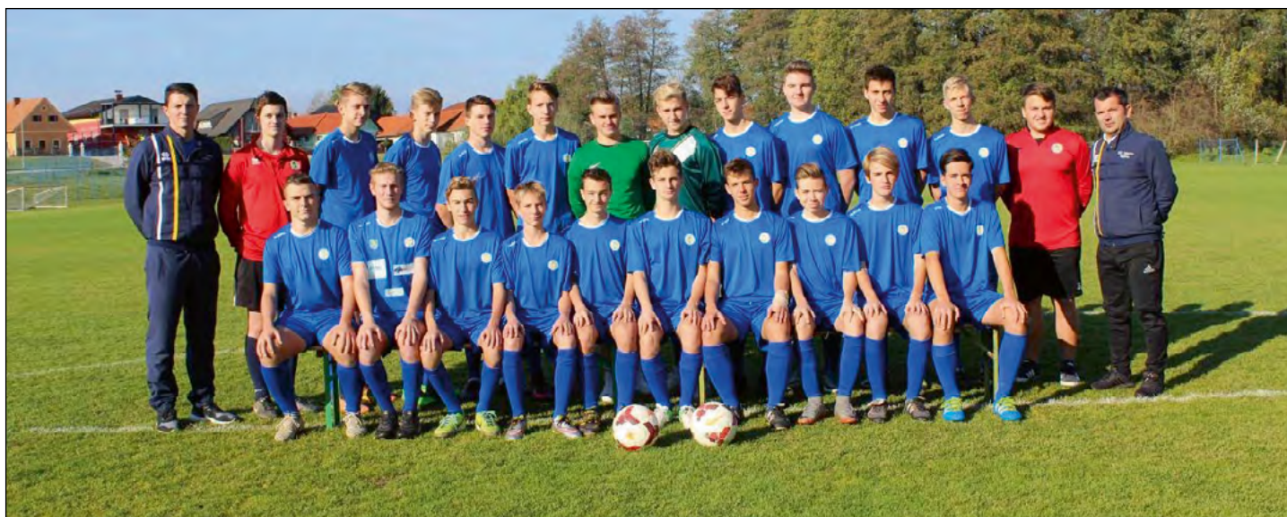
Kadeti U17 in mladinci U19