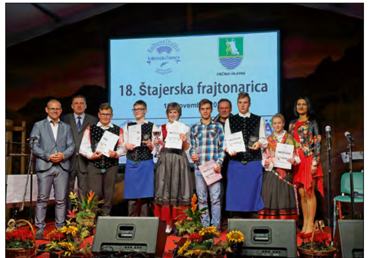
Utrinki z letošnje prireditve v družbi mladih harmonikarjev

S ponosom ugotavljamo, da revija v Sloveniji pridobiva veljavo, kar se odraža v kakovosti igranja, prepoznavnosti in številu prijav. Letos se je prvič zgodilo, da smo imeli večje število prijav, kot jih lahko sprejmemo. Prireditve je potekala v prijetnem tekmovalnem duhu in ni naključje, da so odzivi več kot pozitivni.