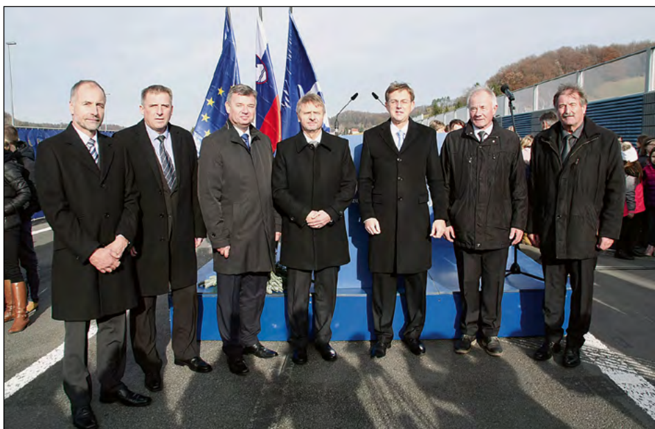
Podravske avtocestne krake je bogatejši za 7,3 km sodobne štiripasovnice.