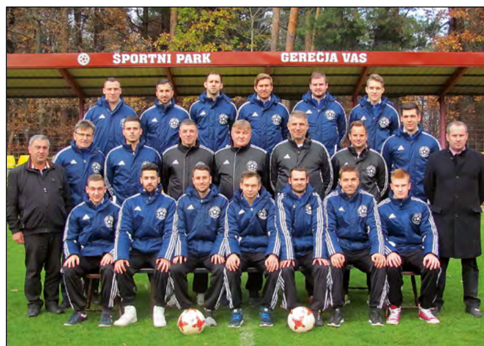
Članska ekipa NK Gerečja vas je jesenski del sezone 2017/18 v Superligi končala pri vrhu lestvice.