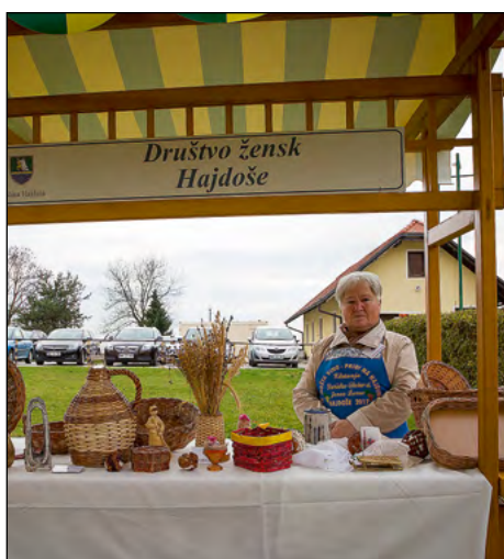
Praznični utrinki leta 2017 na Hajdini ...

V zabavnem delu je za dobro vzdušje skrbel ansambel Slovenski zvoki.