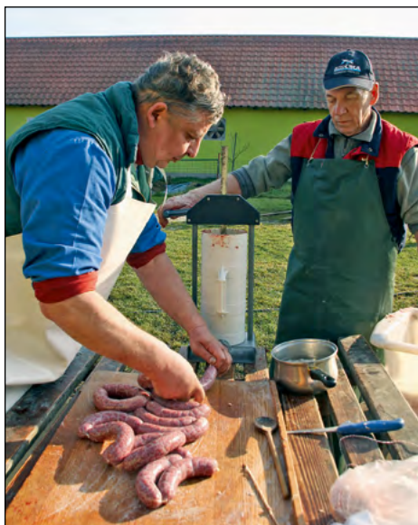
Utrinki z domačih kolin na kmetiji Turnšek v Hajdošah, kjer je bilo 2. decembra veselo in prijetno.