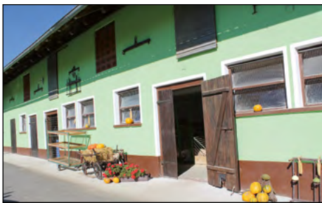
Priznanje za vzorno urejeno kmetijo je prejela kmetija Kirbiš z Zg. Hajdine.