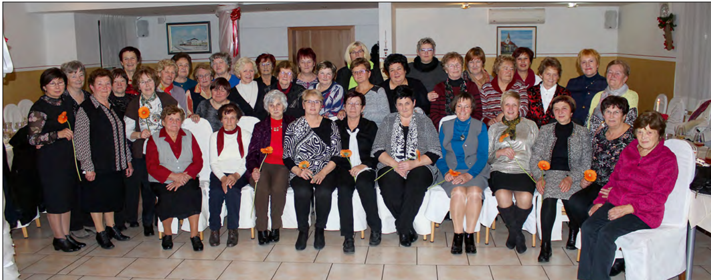
Utrinek s prijetnega druženja Hajdinčank na god sv. Miklavža

Z Miklavževe večerje v Gostilni Čelan v Slovenji vasi, s tradicionalnega srečanja članic Društva žena in deklet občine Hajdina, pošiljamo lep adventni pozdrav vsem bralcem Hajdinčana, še posebej pa tistim članicam, ki niso mogle, hotele ali smele zapustiti varnega domačega ognjišča, da bi se nam pridružile na tem prijetnem druženju.