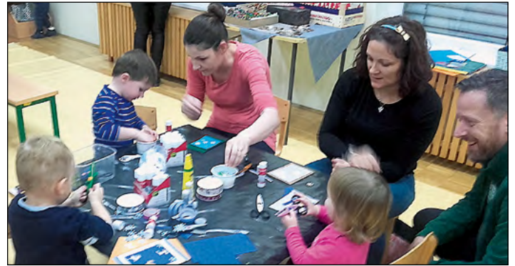
Vzdušje je bilo sproščeno in prijetno.