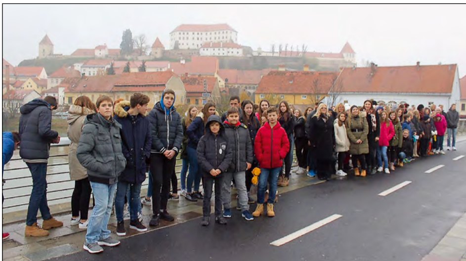
Skupinska fotografija je nastala na ptujskem pešmostu.

OŠ Hajdina že tri leta uspešno sodeluje z OŠ Side Košutić Radoboj na Hrvaškem. Sodelovanje smo najprej vzpostavili učitelji, sedaj pa že dve leti sodelujejo tudi učenci obeh šol.