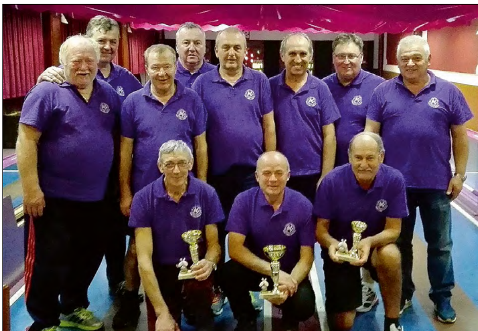
Skupinska fotografija udeležencev v kegljanju