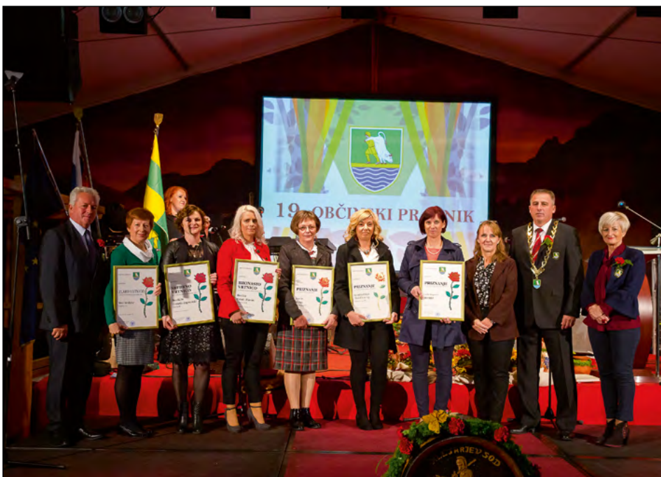
Dobitniki priznanj za urejenost v letu 2017 na osrednji prireditvi ob 19. občinskem prazniku