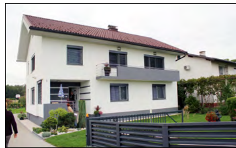
Bronasto vrtnico za vzorno urejeno stanovanjsko hišo je prejela družina Rakuš - Planinc iz Gerečje vasi.