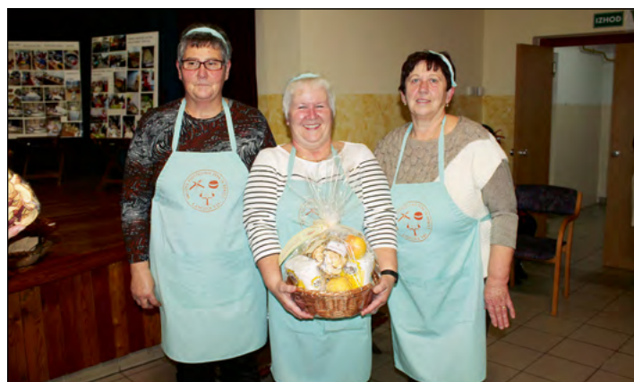
Naj rezance je naredila ekipa iz Društva podeželskih žena in deklet Lancova vas.