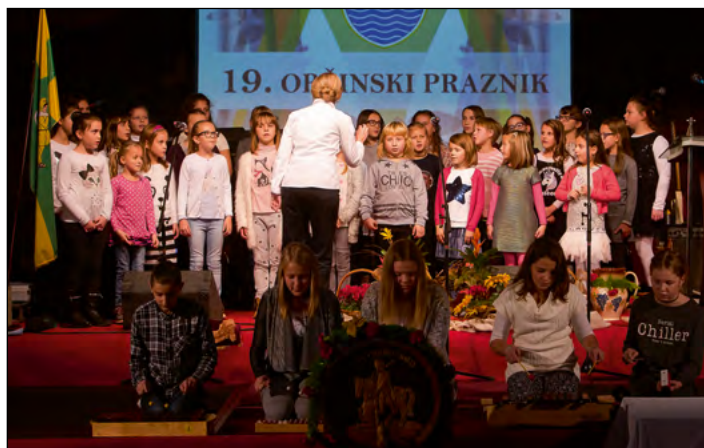
Slovesnost so s pesmijo obogatili mladi pevci OŠ Hajdina.