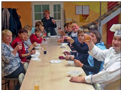
Po pokušini okusnih in zdravih jedi je sledilo še prijetno druženje ob kozarčku rujne kapljice.

Članice DŽD Gerečja vas so v svojo sredino ponovno povabile kuharja Jako, priznanega kuharskega strokovnjaka, ki je za tokratne kuharske delavnice pripravil izbor receptov za jedi iz sladkovodnih in morskih rib ter morskih sadežev.