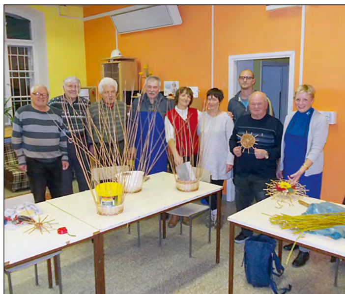
Utrinek z ene od delavnic