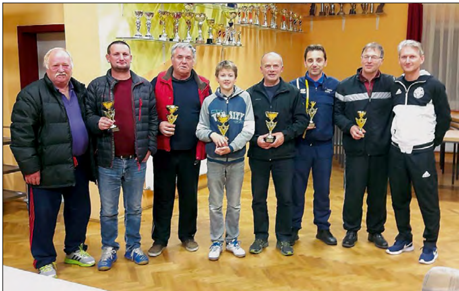
Skupinska slika udeležencev šahovskega turnirja