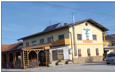
Med poslovnimi objekti je posebno priznanje za urejenost prejela Gostilna Čelan iz Slovenje vasi.