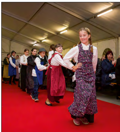
S plesom in pesmijo so se predstavili tudi Martineki – FS OŠ Hajdina.