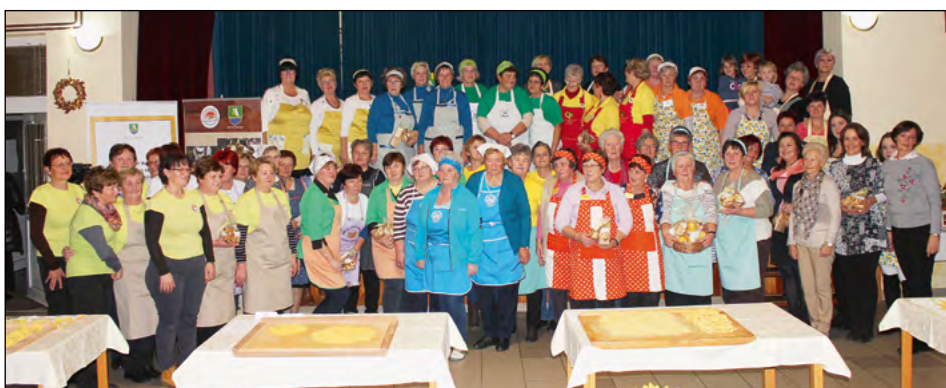
Skupinska fotografija vseh, ki so letos sodelovali na 16. Gospodinjskem večeru v Dražencih.