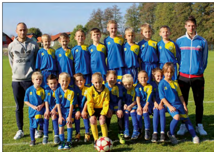
Najmlajši cicibani U6, U7

Za ONŠ Golgeter Hajdina je še ena uspešna polsezona, tokrat jesenski del sezone 2017/2018. Spet je bila polna dogajanja, dobrih in slabih tekem, številnih treningov, zagotovo pa je bila to tudi sezona zabave in uživanja v nogometu.