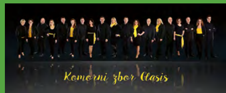
Komorni zbor Glasis