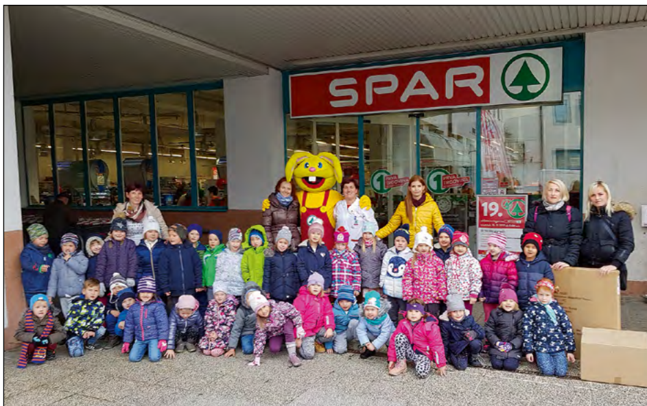
Praznovanje 10. rojstnega dne trgovine Spar na Ptuju skupaj z otroki iz vrtca Najdihojca

Ob koncu praznovanja smo se v rtec odpravili polnih lepih spominov in doživetij na tako poln in vsebinsko