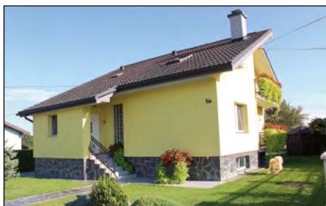
Najvišje priznanje – zlato vrtnico za vzorno urejeno stanovanjsko hišo – je letos prejela družina Glažar iz Hajdoš.