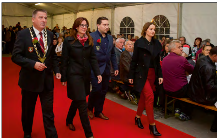
Častna gostja praznične slovesnosti na Hajdini je bila ministrica za obrambo Andreja Katič.