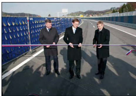
Utrinek s slovesnosti na avtocesti Draženci–Gruskovje.