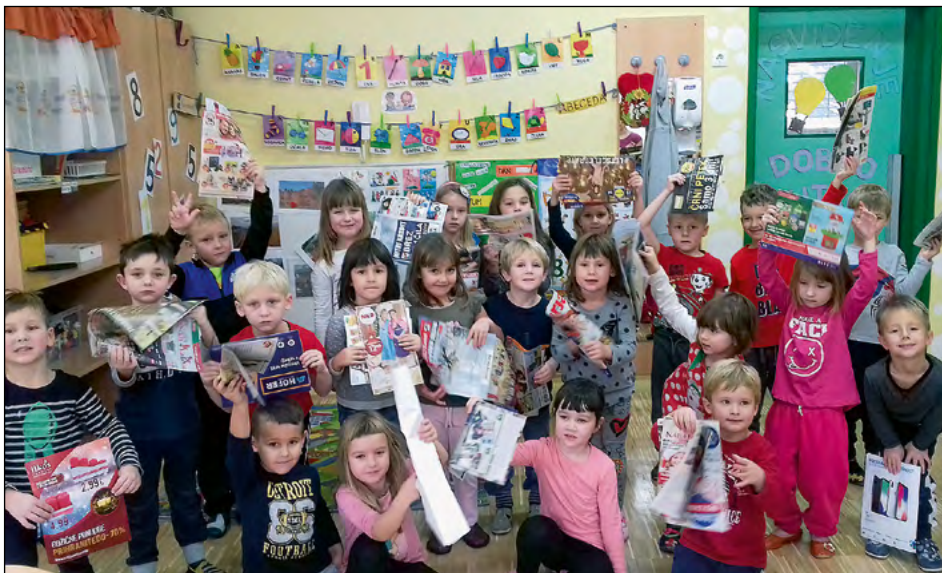
Otroci bele igralnice so zbirali odpadni papir.

Šolski sklad, ki deluje v okviru šole in vrtca, je vsako leto precej dejaven. Trudi se zbirati denarna sredstva za pomoč šolskim in vrtčevskim otrokom. Ena od vsakoletnih akcij je tudi zbiranje odpadnega papirja.