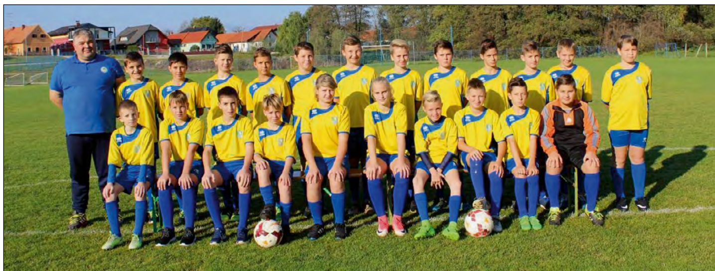
Mlajši dečki U12-U13