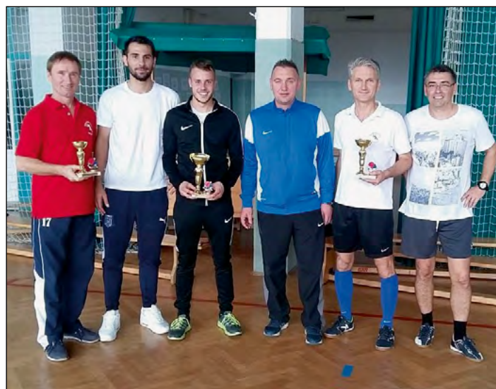
Skupinska fotografija udeležencev v namiznem tenisu