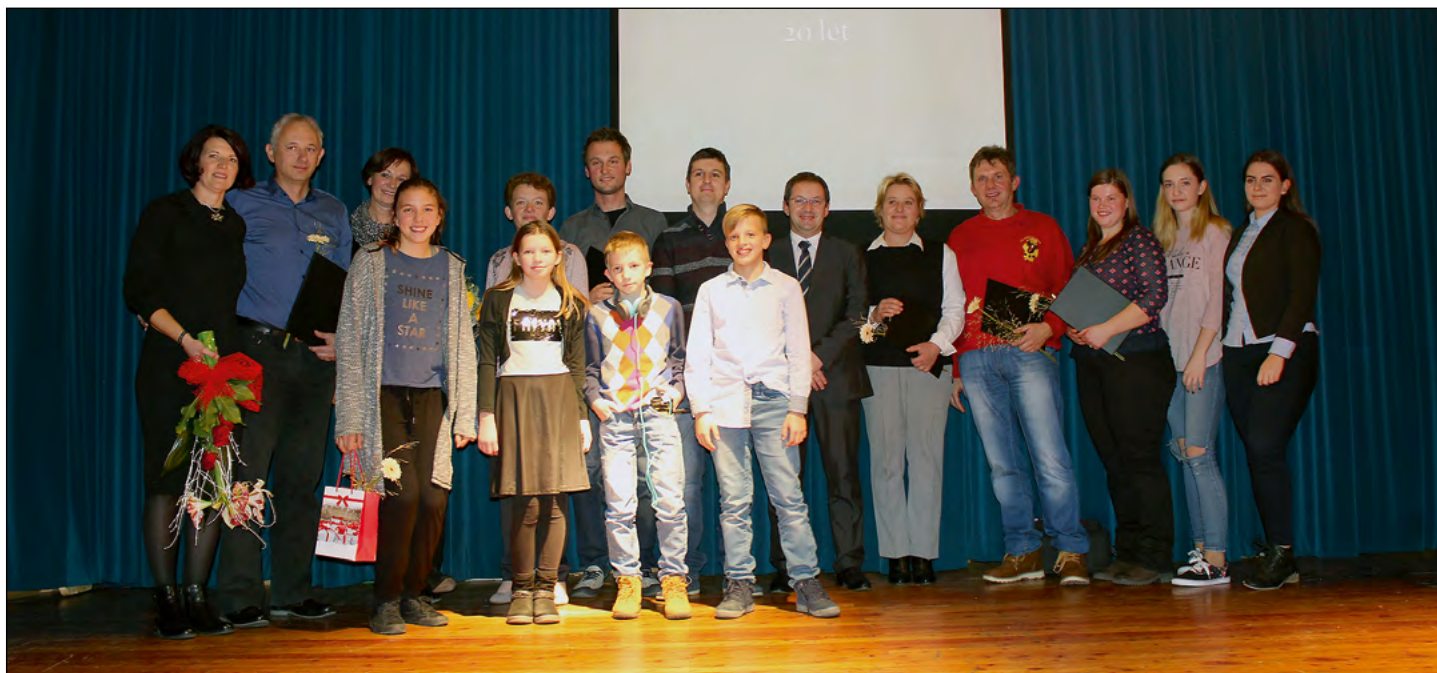
Prejemniki častnih priznanj KD Draženci v družbi nastopajočih