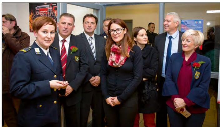
Utrinki z odprtja razstave Olimpijade hajdoških gasilcev, ki je bila na ogled v razstavišču PSC Hajdina.