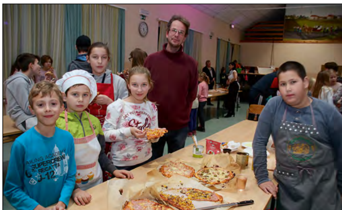
Mladi gasilci so pripravljali slastne pice.