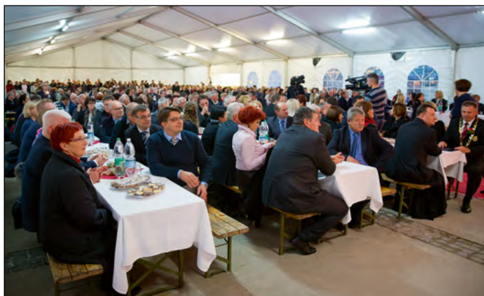
Prireditveni šotor je bil na praznični dan osrednji prostor za druženje in praznovanje.