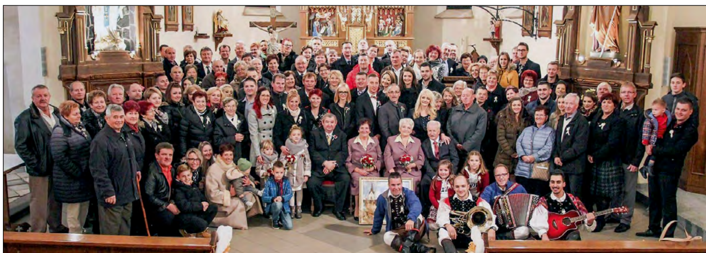
V spomin na zlati poročni dan zakoncev Malinger iz Gerečje vasi in Peklič z Zg. Hajdine