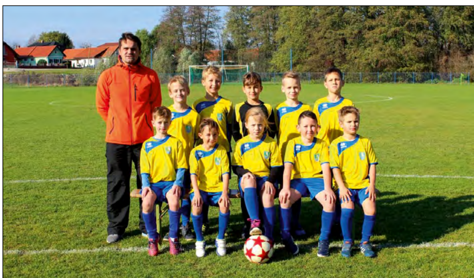
Mlajši cicibani U9