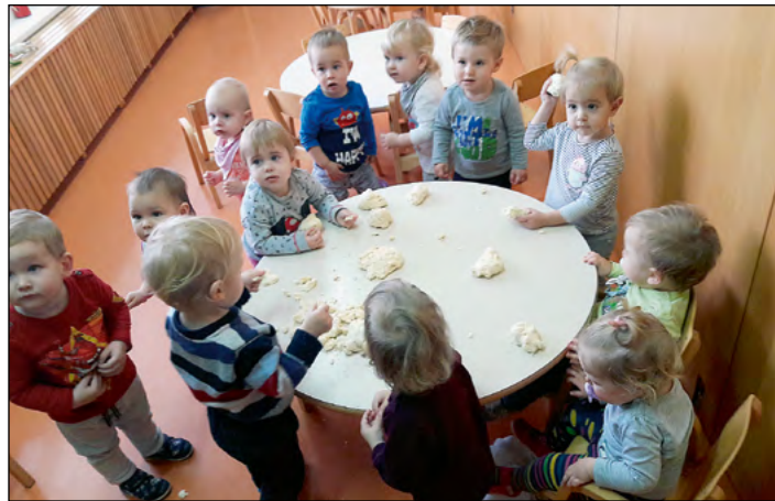
Ob igri s slanim testom že najmlajši razvijamo finomotoriko.