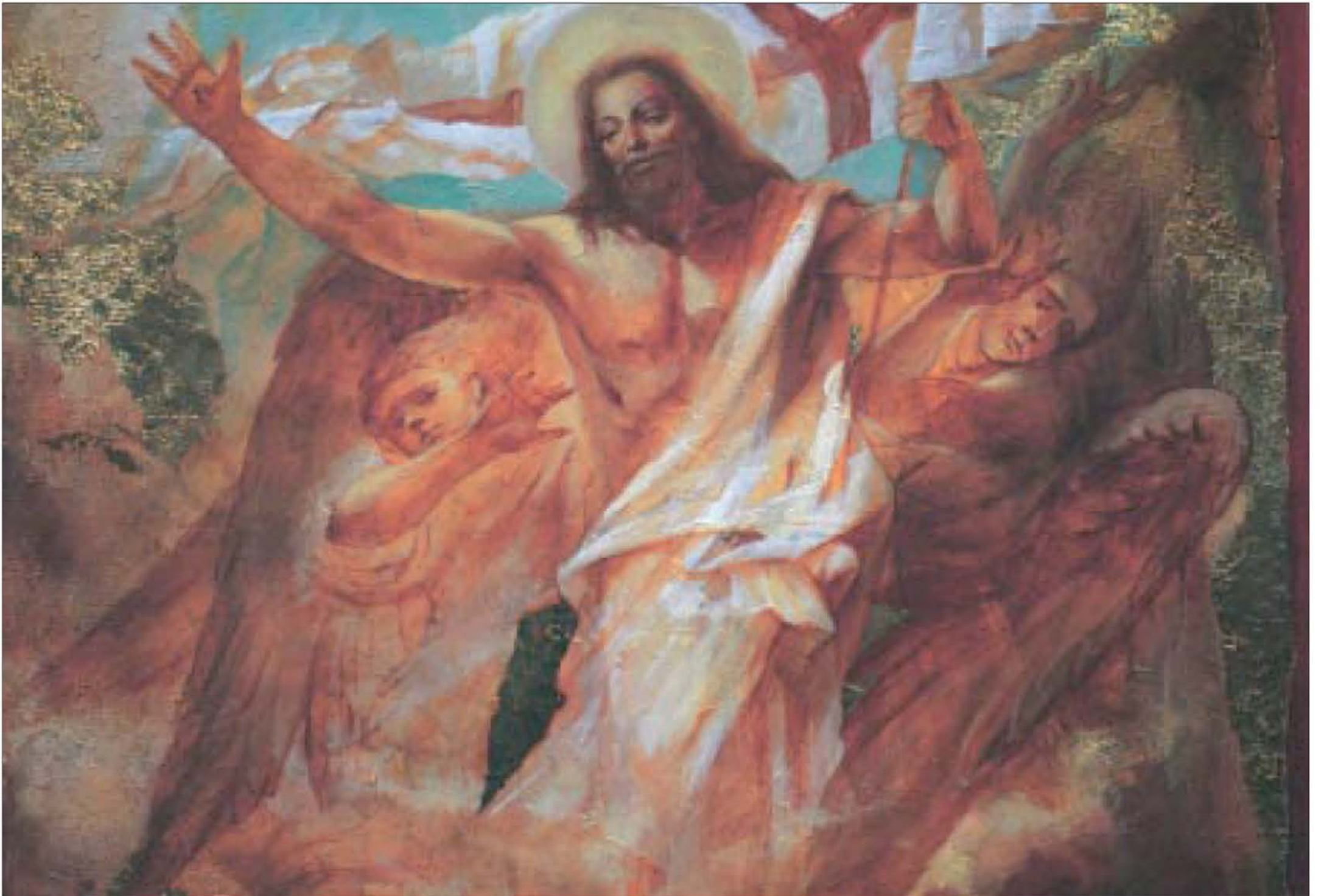
Nikolaj Mašukov, Vstali Kristus, olje na platno