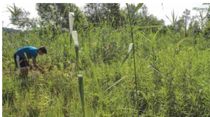
Invazivni kanadska in orjaška zlata rozga tvorita trajne goste sestoje, kjer ne morejo uspevati druge rastline, zato izpodrivata domorodne vrste.

Projektni območji Bodešče in Brje-Zasip sta letošnje zimo dobili novo podobo, saj se je v času, ko so bila tla dalj časa pomrznjena in je bila nosilnost tal najprimernejša, tam odstranila lesna zarast (grmovje in nekaj tanjših dreves). Z njihovo odstranitvijo smo proces zaraščanja in posledično osuševanja upočasnili, učinek pa je opazen že po nekaj mesecih. V Bodeščah se je kljub vročim poletnim dnevom in odsotnosti padavin že vzpostavil predel, kjer se zadržuje voda, kar predstavlja zametek primer-