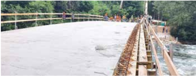
Nadomestna gradnja mostu Piškovca

Gradbena dela znotraj območja ZN Koritno so v polnem teku. Znotraj zazidalne cone ZN Koritno so izvedena vsa dela gospodarske javne infrastrukture, vključno z grobim asfaltiranjem dostopnih cest znotraj cone. Dela se trenutno nadaljujejo v najožjem delu obstoječe ceste Koritno–Ribno, kjer izvajalci izvajajo dela nove komunalne infrastrukture. Izvedena so tudi strojna dela na novem črpališču, ki bo v tem mesecu začelo obratovati. Dela se bodo v tem in naslednjem mesecu nadaljevala z rekonstrukcijo glavne ceste, vključno z izvedbo novega pločnika.