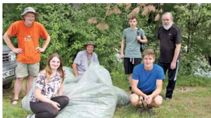
V naravi šteje vsako dejanje. Društvo za varstvo okolja Bled po končani akciji odstranjevanja invazivk.