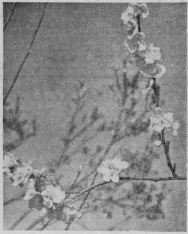
Narava je zopet ožveila

Glasilu Socialistične zveze delovnih ljudi za območje bivšega ptujskega okraja Izdaja »Ptujski tednik«, zavod s samostojnim finansiranjem Direktor Ivan Kranjčič Odgovorni urednik: Anton Bauman. Uredništvo in uprava Ptuj, Lackova 8 Telefon 156, čekovni račun pri Komunalni banki Maribor podružnici Ptuj, št. 604-73-3-206. Rokopisov ne vračamo. Tiska Mariborska tiskarna Maribor. Celotna naročnina za tuzemstvo 750 din, za inozemstvo 1250 din.