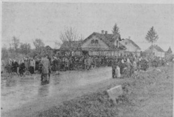
Množica pred Širčevim hišo pred pogrebom. Pri tretji beli hiši desno se je zgodila nesreča.

ZA ČAS OD 8. DO 15. APRILA Maj bo 15. aprila 1961 ob 6.58. — Vreme bo lepo, noči pa še hladne. AC