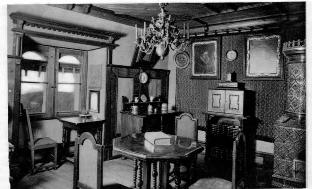
Dogel sobe za knjižnico

H gradu spada tudi obsežno posestvo, ki meri okroglo 1200 oralov, od katerih je pa 1000 oralov gozda.