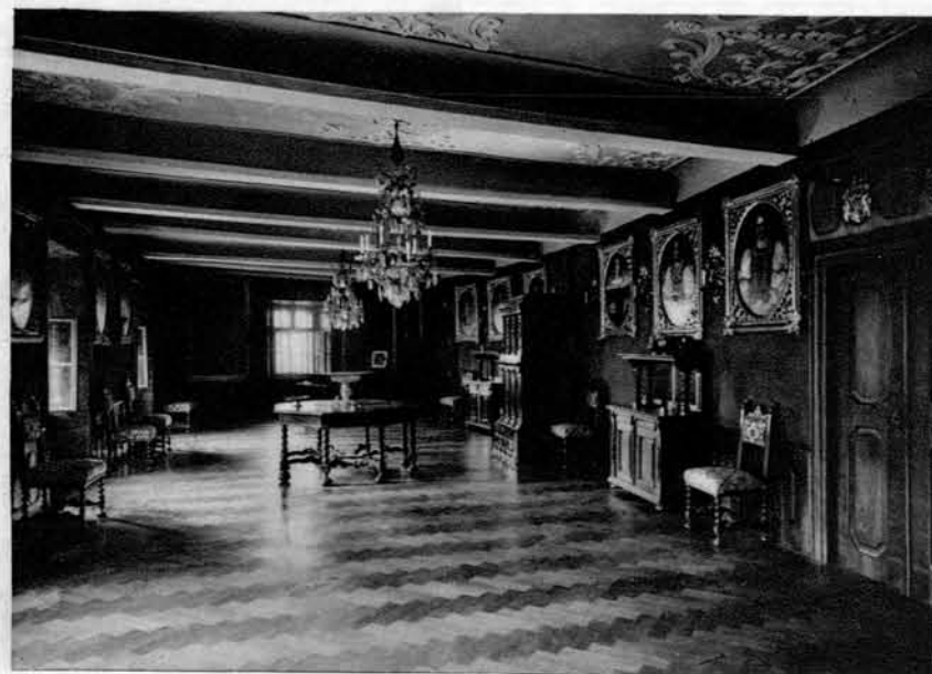
Ena izmed dvoran na pišeškem gradu