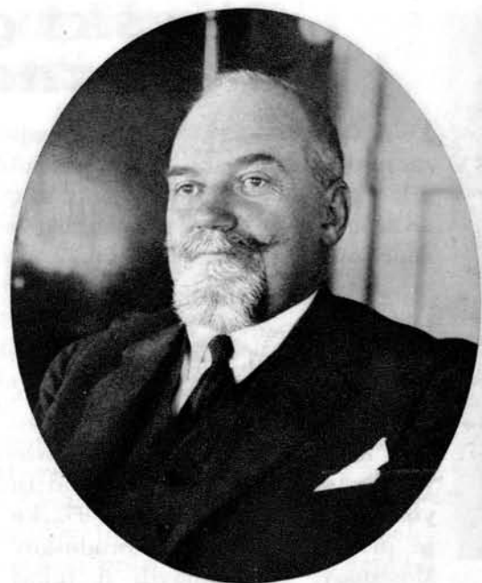
Ignjat Bajloni guverner naše Narodne banke.