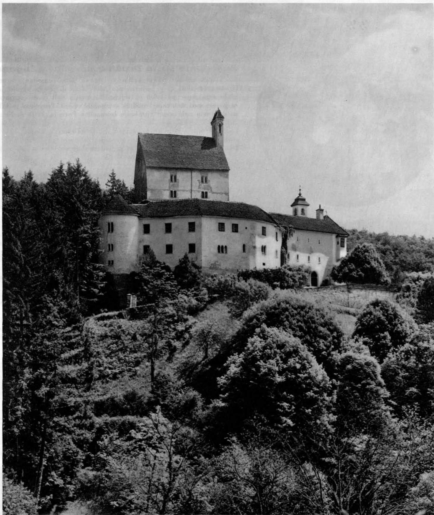
Iz slovenske zgodovine: Grad v Pišecah