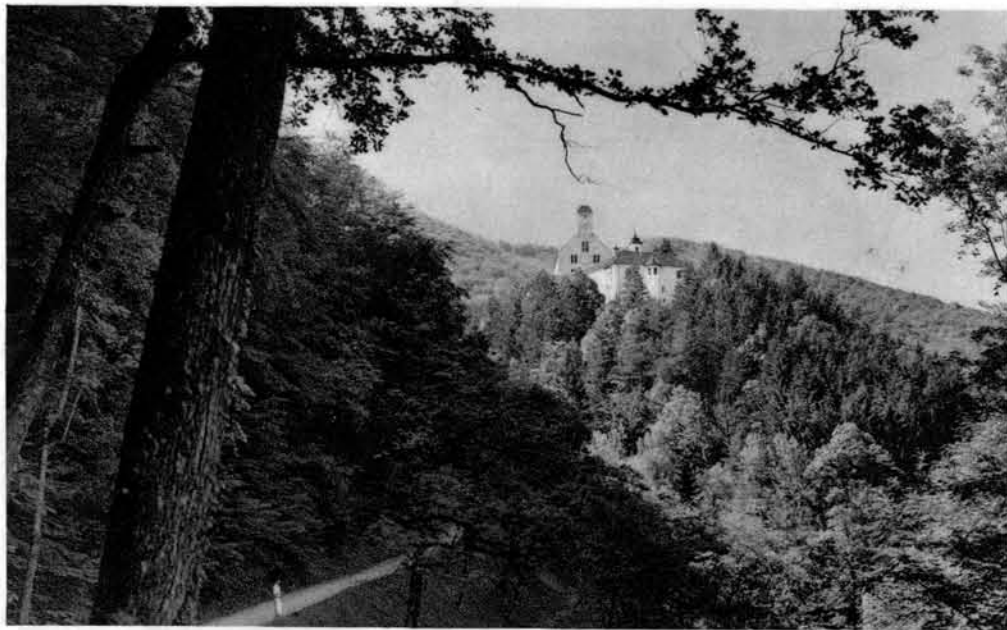
Pogled na grad Pišece