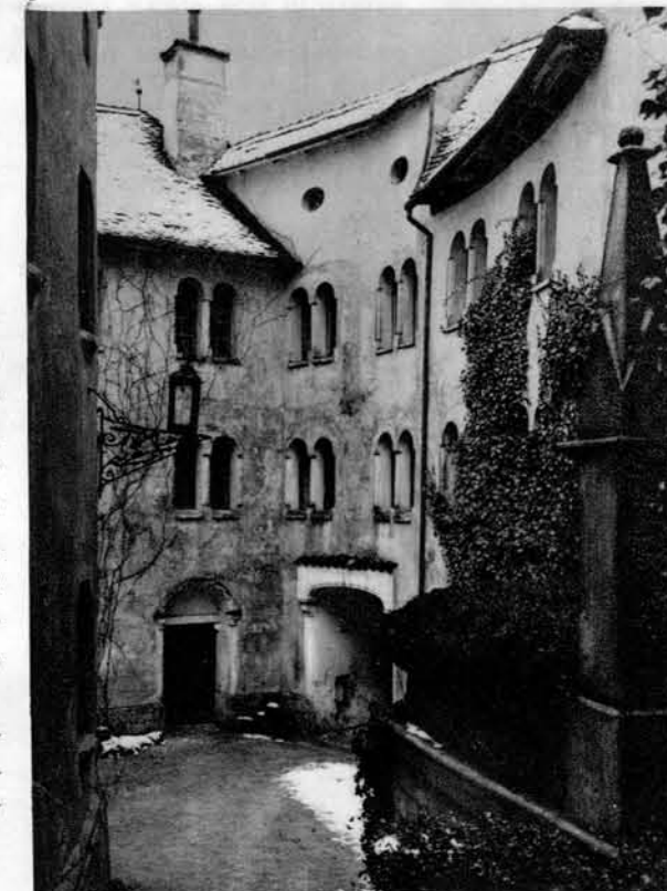
Motiv iz grajske notranjščine