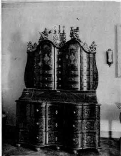
Star sekreter v salonu