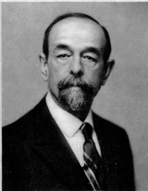
Knez Ivan (1855—1927), veletržec in industrijalec.