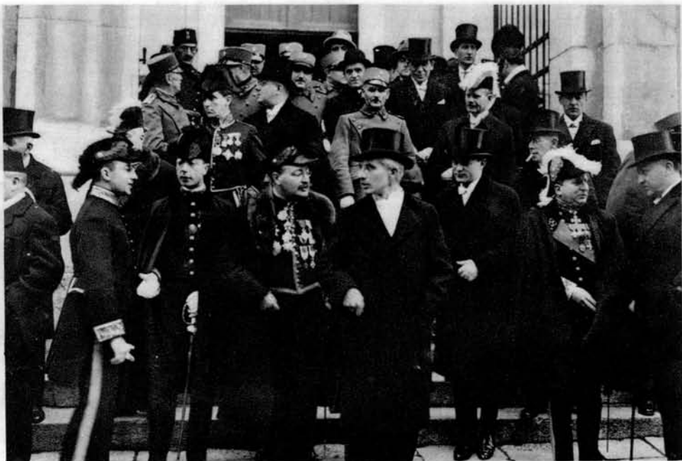
S proslave 10let. našega drž. zedinj. v Belgradu Diplomatski zbor in drugi dostojanstveniki zapuščajo saborno cerkev po slovesni službi božji.