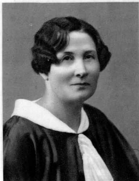
Klemenčič Ivanka (* 1876), časnikarica.