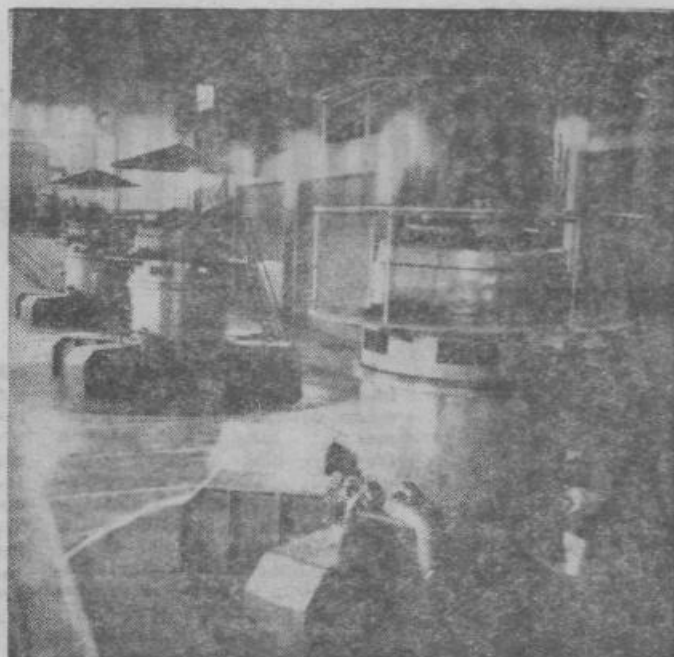
Pogled v oddelek Tovarne »Oktobarska sloboda« v Beogradu.

Iz razpoložljivih podatkov je razvidno, da so v prvih 9 mesecih letos dosegli vidne rezultate. Tako je bilo na primer samo pri zmanjšanju odpadkov doseženo nad 11.200.000 din prihranka pri premogu 2.935.000, pri režijskem materialu pa nad 360.000 din. Delovna produktiv-