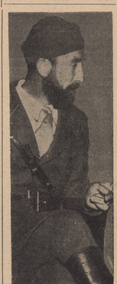
Svečnik V. Zečević, minister notrajnih zadev Nar. Vlade.