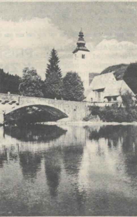
CERKEV SV. JANEZA stoji na severni strani odtoka Bohinjskega jezera in je neverjetno skladno vključena v okolico.

Prosimo, poravnajte naročnino in s prispevki v tiskovni sklad pomagajte našemu listu za uspešno ohranjanje med nami naše materine besede!