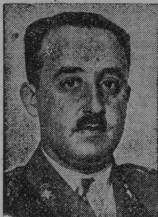
General Franco, duša španskega upora.