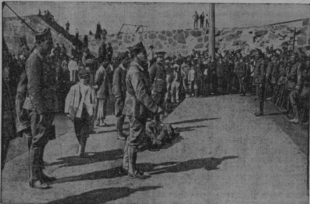
Nagovor španskega generala Franca na tretjo tujsko legijo v Melilli. kjer je središče upornikov.