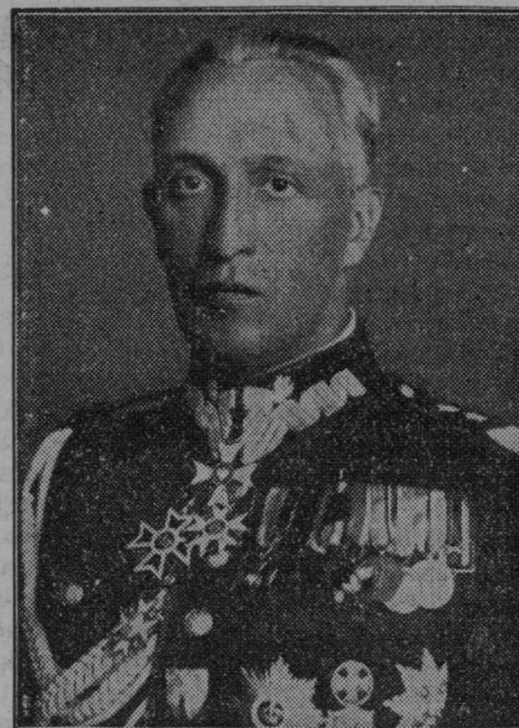
General Orlicz-Dreszer, poveljnik zračnega brodogva na Poljskem, se je smrtno ponesrečil z aeroplanom.