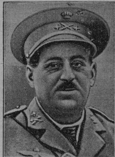
Španski general Sanjurjo, ki je živel v pregnanstvu na Portugalskem. Ob izbruhu upora se je hotel prepeljati v letalu na Španjo, da bi vodil upor. Aeroplan je treščil na tla in slavni general se je ubil.