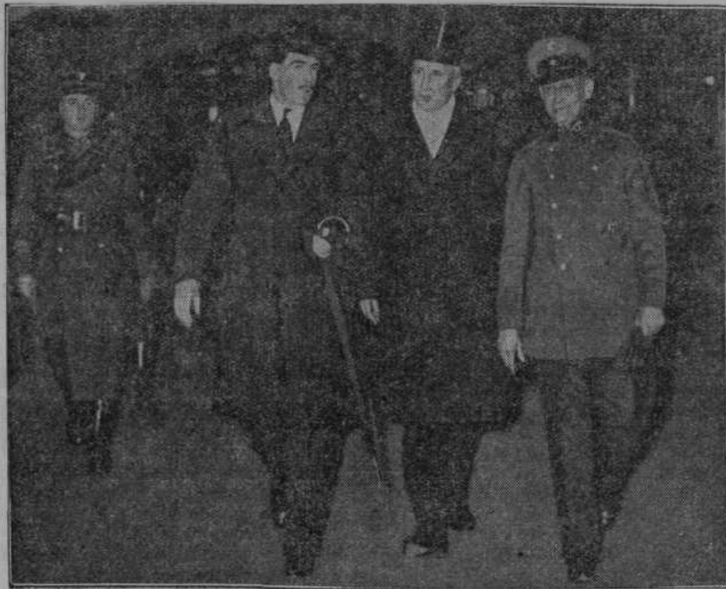
Z angleško-nemških pogovorov v Berlinu. Angleški državnik Eden (levo) in nemški državni tajnik pl. Bülow pri slovesu iz Berlina dne 26. marca na kolodvoru.