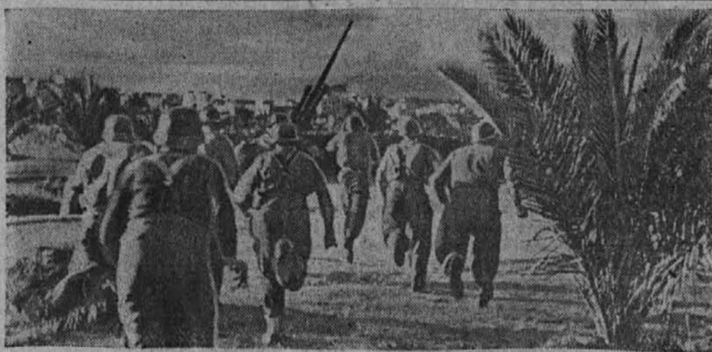
Alarm na tuniški fronti