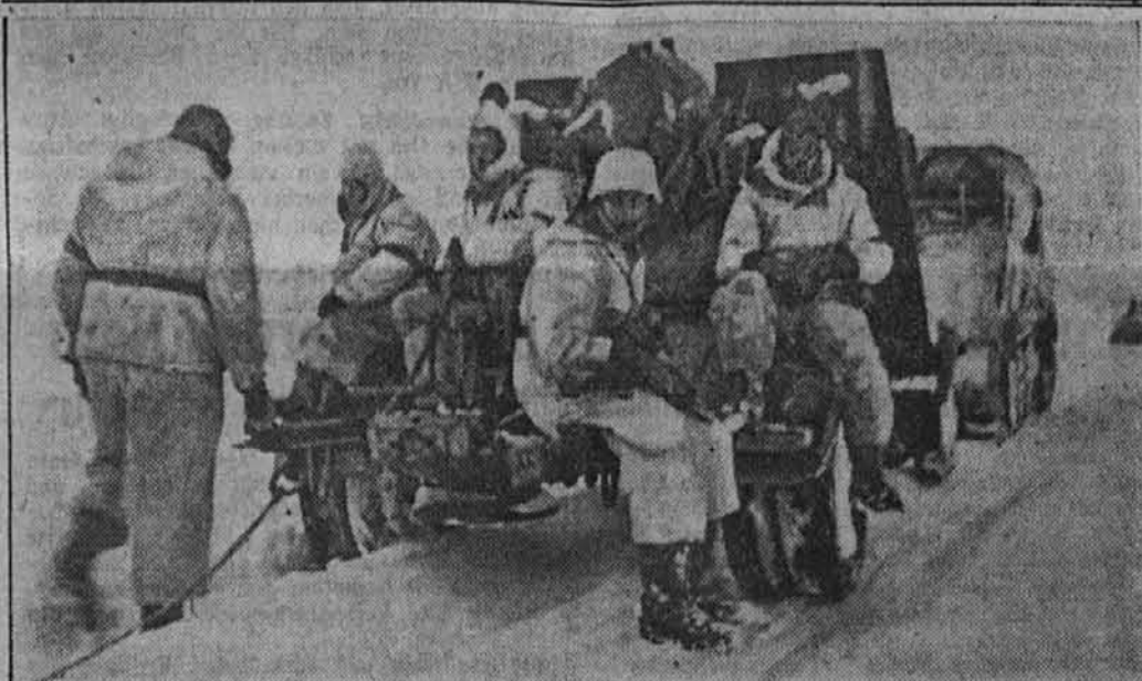
Protiletalsko topništvo gre v postojanke

Angleški delavec lahko zve podrobnosti tega načrta, kot tudi še druge, zaenkrat samo še na papirju zapisane, namere, od Deutschen Arbeitsfront. Vedno ponovno se pri takih prilikah pokaže, kako zelo je socialno zaostala Anglija v primeri z Nemčijo in drugimi državami, tako da mora socialne samoumevnosti drugih držav sedaj šele odkriti kot velik napredek.