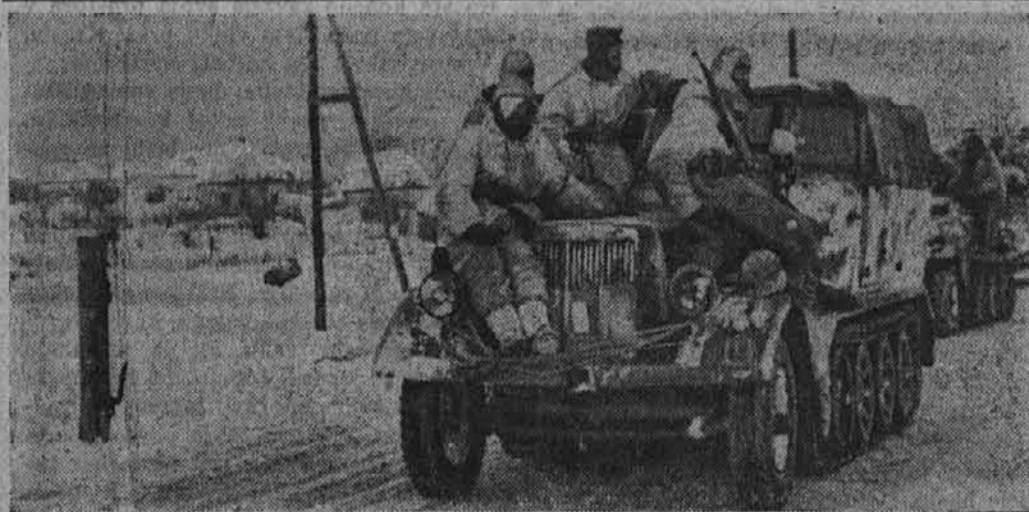
Sedeč na verižnih vozilih

V distriktu Radom bodo letos zasadili 700 ha zemlje s kok-sagisom, neko rastlino, ki je zelo podobna regratu.