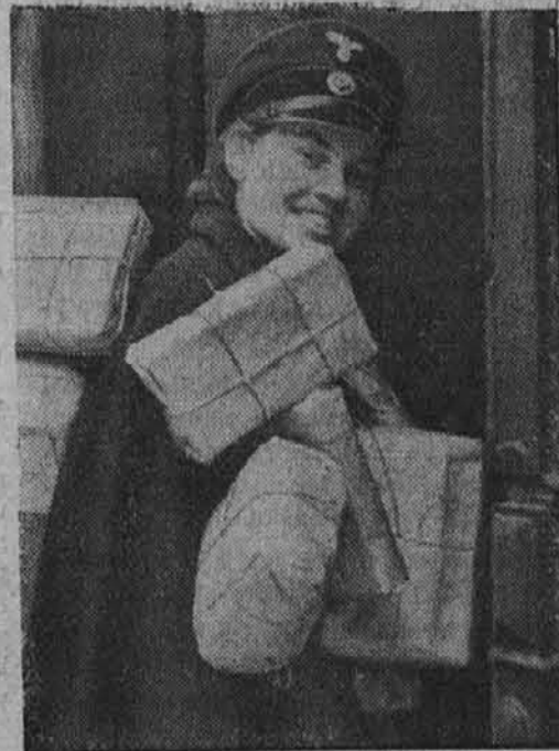
Tudi žena pomaga zmagati

Mnoge nemške žene nadomeščajo v važnih službah može, ki se bojujejo na fronti, in vsaka posamezna izmed njih prispeva s svojo samo ob sebi razumljivo izpolnitvijo dolžnosti k izvojevanju končne zmage.