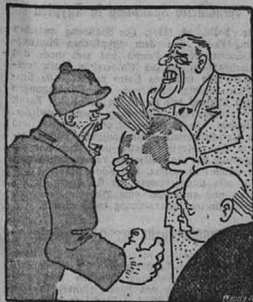
Evropa se ponuja!

Optiki vojne odgovarja optika delavnega, pridnega, v vseh poklicnih plasteh delujočega in požrtvovalnega nemškega naroda. Poziv Führerja za obvezno službo v domovini je dobil pričakovani odmev. V Gauu Kärnten se je do danes prostovoljno javilo 1141 moških in 2743 žen za celodnevno delo in 464 moških in 3638 žen za poldnevno zaposlenje. Mnogo obratov je samih od sebe uvedlo oklopne posade za povečanje proizvodnje. Dogode se ganljivi primeri naj-