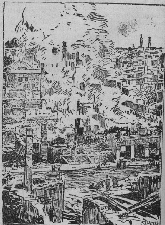
Die Brandruinen von Stambul