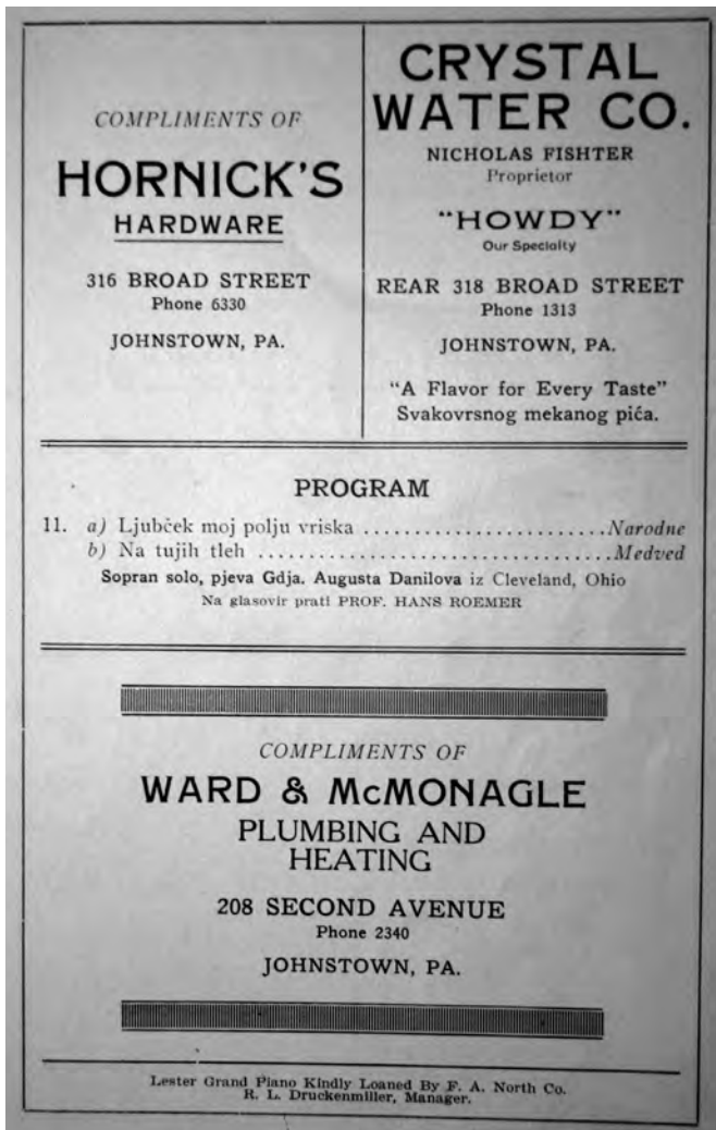
Slika 1. Stran iz programske knjižice koncerta hrvaškega prosvetnega društva Rodoljub leta 1925, na katerem je kot gostja nastopila Avgusta Danilova in izvedla pesmi, ki jih je snemala tudi za gramofonske plošče (SGM 1925).

Gotovo pa tega ne bi mogli trditi za vse pesmi, predvsem ne za manj znane ali strukturno kompleksnejše ali za tiste, ki so prirejene za večje vokalne ali instrumentalne zasedbe; te so izvajalci gotovo povzemali iz tiskanih oz. pisnih virov.