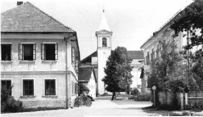
Nekdanja šola na Vidmu

la le tri leta in kakor koli se sliši nenavadno bila pri svojih 23. letih med najstarejšimi na šoli. Bila je razredna učiteljica, vendar je zaradi pomanjkanja učiteljev poučevala slovenščino. Nekdanji učenci se jo spominjajo kot strogo, a dobro učiteljico.