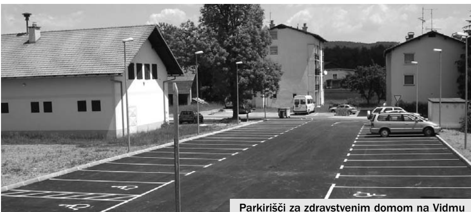
Parkirišči za zdravstvenim domom na Vidmu

Občinska uprava je pripravila Program opremljanja oskrbe z vodo v naselju Tisovec z namenom pridobiti osnovo za sprejem odloka o plačilu komunalnega prispevka, ki se nanaša na vodooskrbo v tem naselju. Osnova za pripravo Progra-