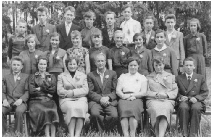
Učenci in učitelji 4. razreda nižje gimnazije na Vidmu, junij 1956

V nadaljevanju objavljamo verze, ki jih je Jože Gruden namenil svojim sošolcem ob 50-letnici valetе.