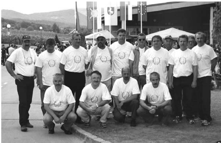
Veterani vojne za Slovenijo na športnih igrah

Po tekmoivanju so nas gostitelji OZVVS Slovenske Konjice pogostili ter počastili z vstopnicami, da smo si ogledali Zasebno muzejsko zbirko vojaških predmetov avstroogrskega obdobja, Mestno galerijo Riemer in degustacije vina iz tega območja v Vinoteki Stari trg. ♦