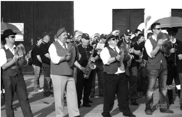
Skupni nastop vseh godb in pihalnih orkestrrov