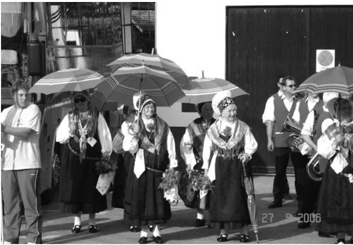
Narodne noše prispevajo k prazničnemu vzdušju.

V soboto, 27. maja popoldne, je vas Kompolje dobila slovesno in praznično podobo, ki jo je s svečano parado in revijo godb ter pihalnih orkestrrov omogočilo Kulturno društvo Godba Dobropolje pod pokroviteljstvom občine in JSKD OI Ivančna Gorica.