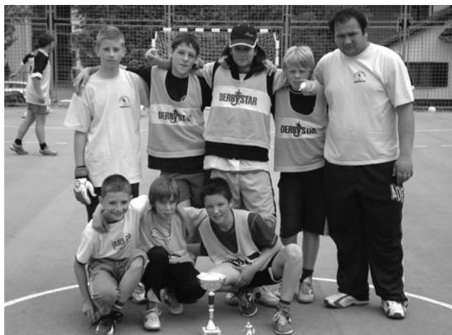
Zmagovalna ekipa ŠD Kompolje – dečki do 12 let