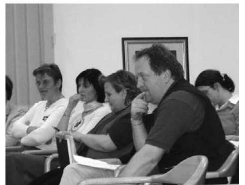
Občnega zbora so se udeležili predstavniki vseh društev