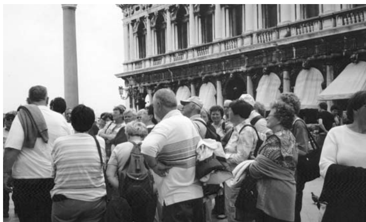
V Benetkah na Markovem trgu. Pozorno poslušanje vodnika.