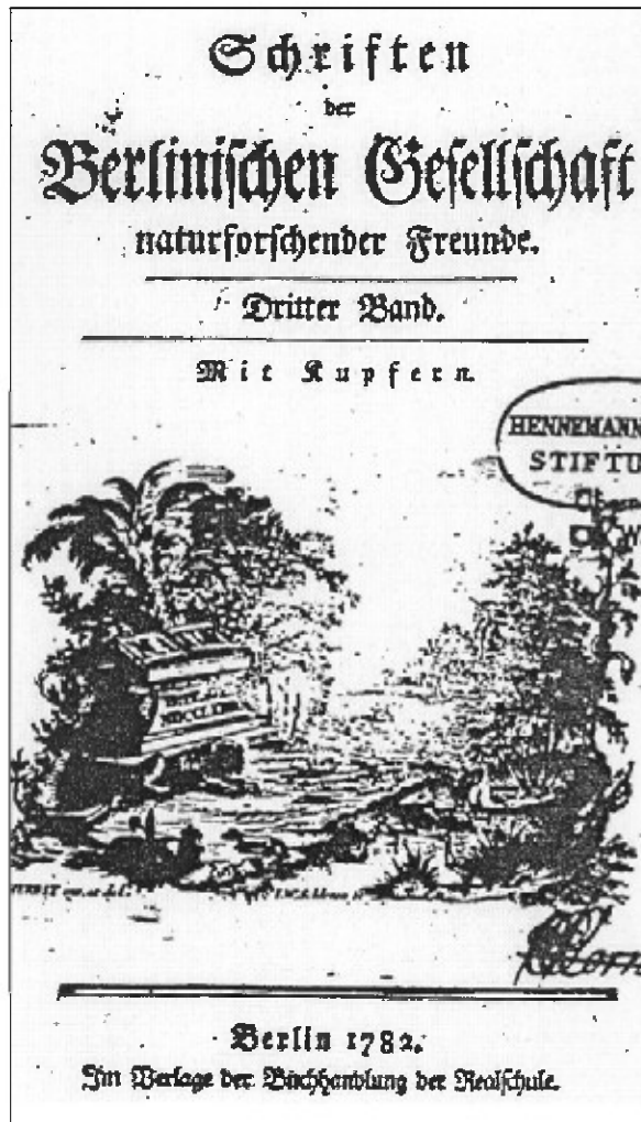
Naslovnica Schriften der Berlinischen Gesellschaft naturforschender Freunde (1782).