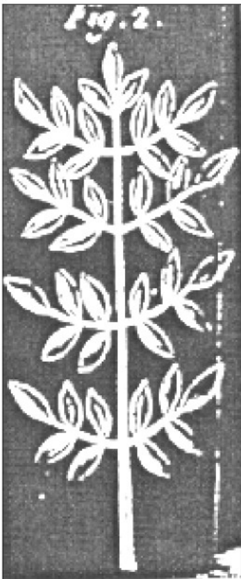
Rastlina iz Meke, ki jo je Hacquet narisal povečano po treh eno colo dolgih primerkih, ki mu jih je poslal Reineggs. Hacquet je rastlino po Linnéju uvrstil med limonovce ( Schriften der Berlinischen Gesellschaft naturforschender Freunde (3): Tab. 3, fig. 2).

Archiv. Od 1784. do 1803. je izdal 40 volumnov revije Chemische Annalen für Freunde der Naturlehre, Arzneygelahrheit, Haushaltung und Manufakturen pri J. G. Müllerju. Od leta 1785 do 1790 je objavil 6 volumnov revije Beiträge zu der Chem. Annalen . Leta 1785 in 1786 je izdal 5 volumnov revije Auswahl aller eigenthüml. Abhandl. Aus d. Neuest. Entdeckungen d. Chemie . Leta 1798 je izdal prvi volumen revije Neuestes Chemisches Archiv . 86