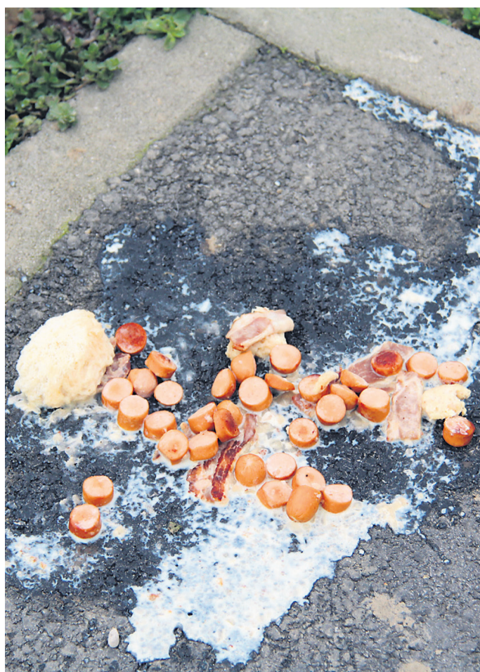
Pomije ali hrana za pse kar na asfaltu

Člani Športno-rekreacijskega društva (ŠRD) Zabovci, ki za celotni športni prostor vzorno skrbijo od njegovih začetkov, opozarjajo, da uporabniki PZA velikokrat za seboj puščajo odpadke, pa tudi iztrebke. Ker so domačini športni park gradili z ogromno lastnega dela in truda, jih posvinjana okolica, ki jo za seboj puščajo raznorazni kampisti, precej moti. Roko na srce, brez domačinov in številnih ur njihovega prostovoljnega dela v minulih 20 letih ta prostor zagotovo ne bi bil tako urejen, kot je: čist, trava redno pokošena, okolica zasajena z okrasnim grmičevjem in cveticami. Športni park je priljubljeno zbirališče vseh generacij, od otrok, mladine, mladih družin, do najstarejših. Številni domačini tam preživljajo svoj pros-