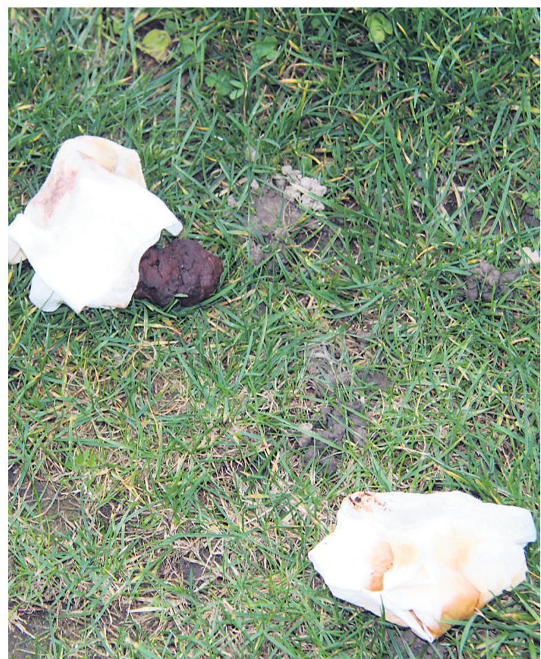
Stranišče na zelenici ...

Z ureditvijo PZA in prihodom številnih tujih ljudi se je na prostoru marsikaj spremenilo. Člani ribiške sekcije, ki deluje v okviru ŠRD, opozarjajo predvsem na nečistočo, ki ostane za avtodomarji. To niso samo drobni odpadki (plastenke, papirčki, cigaretni ogorki, prazne škatlice od cigaret ...), temveč tudi človeški in živalski iztrežki, ki ležijo po zelenicah in mivki na odbojškarskem igrišču. Ker se na prostoru zadržuje veliko ljudi, med njimi tudi mlade družine z otroki, to ni samo moteče, temveč zaradi potencialnih okužb in boleznih celo nevarno. Zgodi se tudi, da avtodomarji svoje pse prosto puščajo in s tem druge obiskovalce parka izpostavljajo nevarnosti.